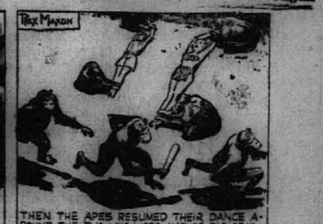
THEN THE APES RESUMED THEIR DANCE AROUND THE TWO WHO WERE MARKED FOR DEATH.

Opica, ki je skočila na Tommyja, ga je potegnila z drevesa in oba sta padla na Tarzeela.