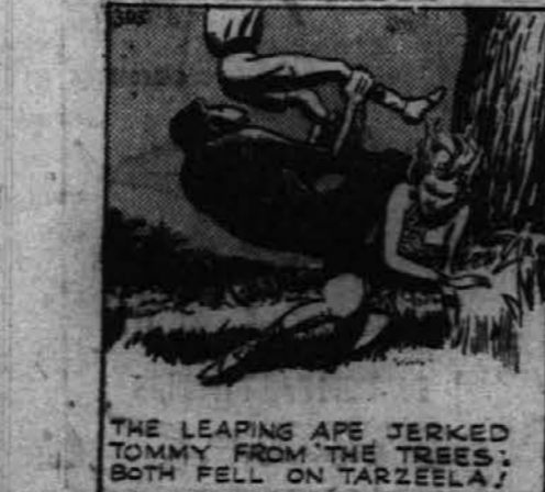
THE LEAPING APE JERKED TOMMY FROM THE TREES; BOTH FELL ON TARZEELA.