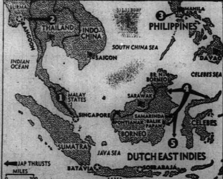
Po zavzetju Maleje ni trdnjave Singapor ter zasedbe številnih krajev na otokih Borneo in Celebes, so Japonci napadli tudi še otok Sumatro, dočim pride otok Java sdaj na vrsto. Na severu pa vdirajo nasprotno njila čete iz Thailanda v Burmo.