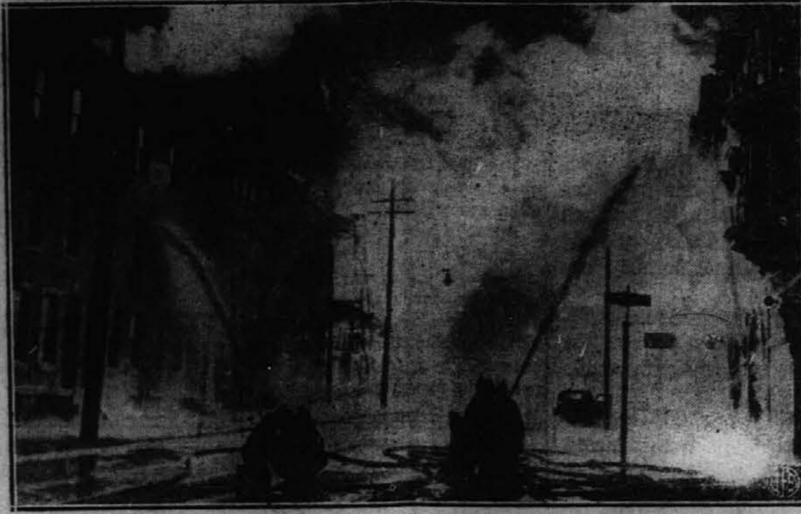
Silovit ogenj, popeševan od močnega vetra, je nedavno objel cele tri bloke v nekem delu mesta Philadelphia, Pa. ter povzročil okrog milijona dolarjev škode, predno so ga zadušili. Slika kaže ognjegaše pri delu.

Posebno sumljiva stran naj-novejše nazijske radio propagande je, kakor preiskava razodeva, veliko številno poročil, iz katerih bi se dalo sklepati o predstoječem nemškem razpadu. Lahkotam kakor so taka poročila prišla skozi, vzlic nazijski cenzuri, ki po navadi tako tesno vse zapira, je nekaj jako čudnega. K njim se sedaj dodaja kratkovalna priznavanja iz Berlina o resnih domačih težavah. To vse utegne pomenjati, da Nazijci sedaj hočejo namenoma vzbuditi čut brezbriznosti med Američani, češ, kaj bi se toliko napenjali, ko bo itak tako lahko zmagati.