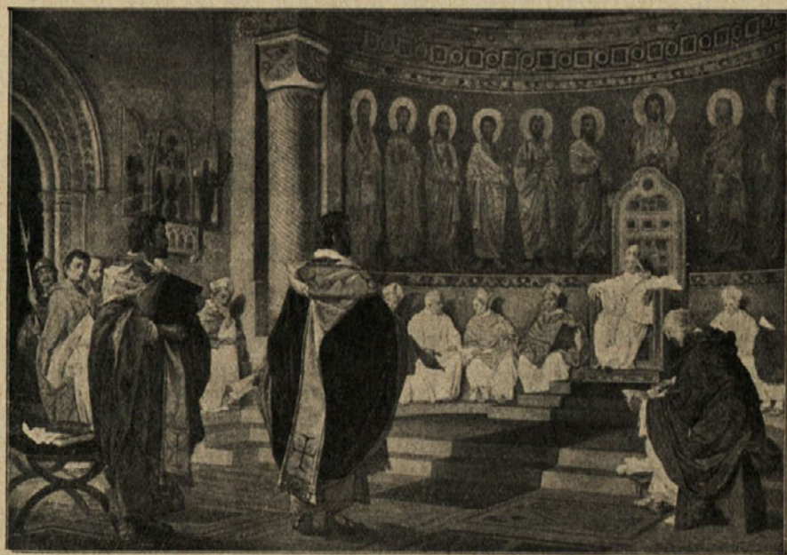
Slovanska apostola pred papežem Nikolajem II.

Velika moravska država se je tedaj razprostirala ob Donavi in je obsegala sedanjo Moravsko in Slovaško ter velik del Nižje Avstrije. Njeni prebivavci so bili Slovani, ki so krščansko vero sprejeli od nemških misijonarjev; Pasav je bila misijonska postaja za te kraje. Krščanstvo pa med ljudstvom ni moglo pognati korenin; narod je sicer prejel sv. krst,