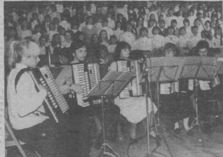
Na občinski proslavi je poleg vevškega pihalnega orkestra ter združenih moških in mešanih zborov zaigral tudi harmonikarski orkester KUD Vide Pregrac, zapeli pa so združeni pionirski in mladinski pevski zbori.

Štafeto mladosti smo v naši občini, tako kot tudi drugje v Ljubljani, sprejeli 24. aprila. V občini se je štafeta držala le dvajset minut, osrednja občinska prireditelj je bila v Blagovno-transportnem centru. Na sliki: prihod štafete v BTC