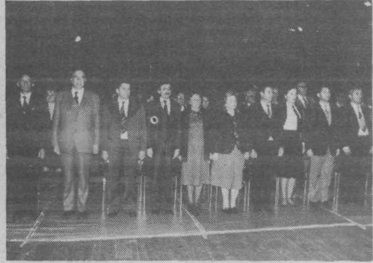
Gostje na občinski proslavi ob igranju Internationale

kažejo, da se obseg proizvodnje ni povečal; ponekod je celo znatno manjši. Ob samokritičnem pogledu tako na tem kot na drugih področjih, ob uspehih ugotavljamo tudi številne slabosti domala na vseh področjih življenja in dela. Vse prevečkrat gre za nedoslednost, neodgovornost — predvsem takrat, ko se za kaj demokratično dogovorimo, izpeljemo pa ne. Današnji čas zahteva več spoštovanja in delovne discipline. Tudi v družbenopolitičnem življenju in delu