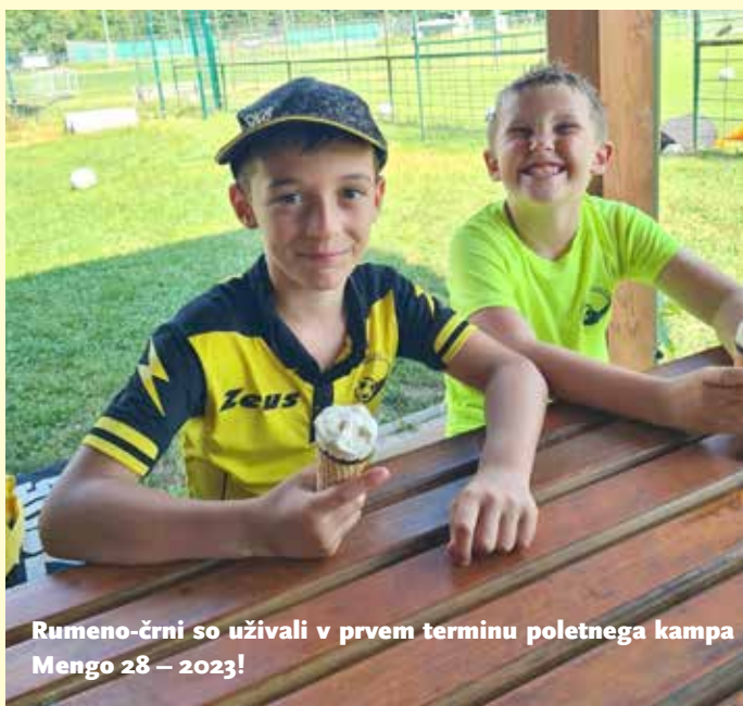
Rumeno-črni so uživali v prvem terminu poletnega kampa Mengo 28 – 2023!

V juniju smo sezono zaključili s klubskim piknikom, kjer se je po naših igriščih mudilo več kot 200 otrok in staršev. Odigrali smo tudi nekaj tekem med starši in otroki, kjer so bili zmagovalci vsekakor naši rumeno-črni nogometaši. V zadnjem tednu junija smo uspešno zaključili še prvi termin poletnega nogometnega kampa, kjer so otroci dodatno nadgrajevali nogometno znanje, se kopali v bazenu v bližnjem Kamniku, igrali različne igre in se imeli preprosto lepo.