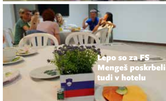
Lepo so za FS Menguš poskrbeli tudi v hotelu