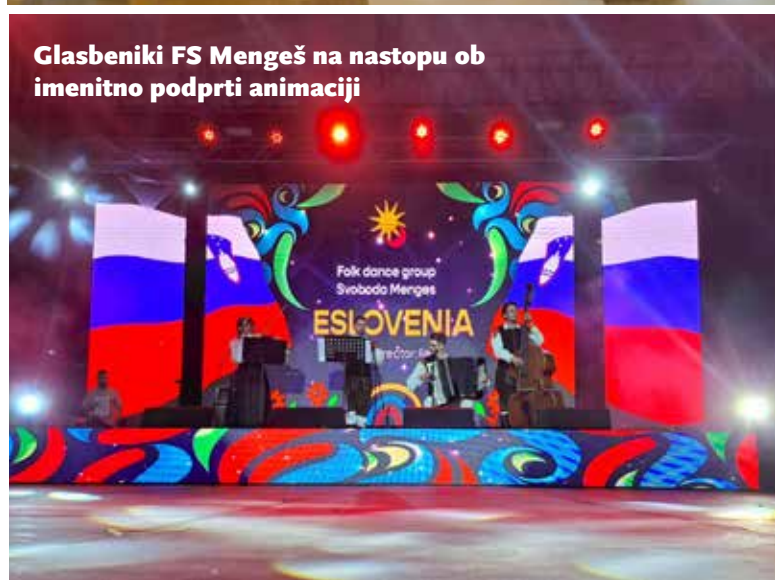
Glasbeniki FS Mengeš na nastupu ob imenitno podprti animaciji

Besedilo: Urška Vahtar