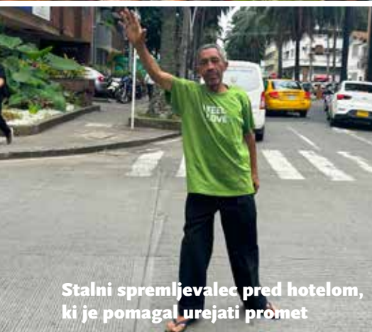
Stalni spremljevalec pred hotelom, ki je pomagal urejati promet