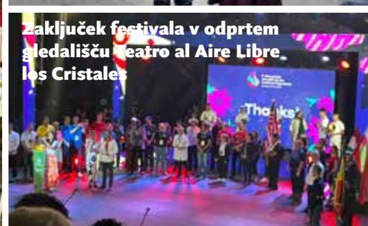
Zaključek festivala v odprtem gledališču Teatro al Aire Libre, los Cristales