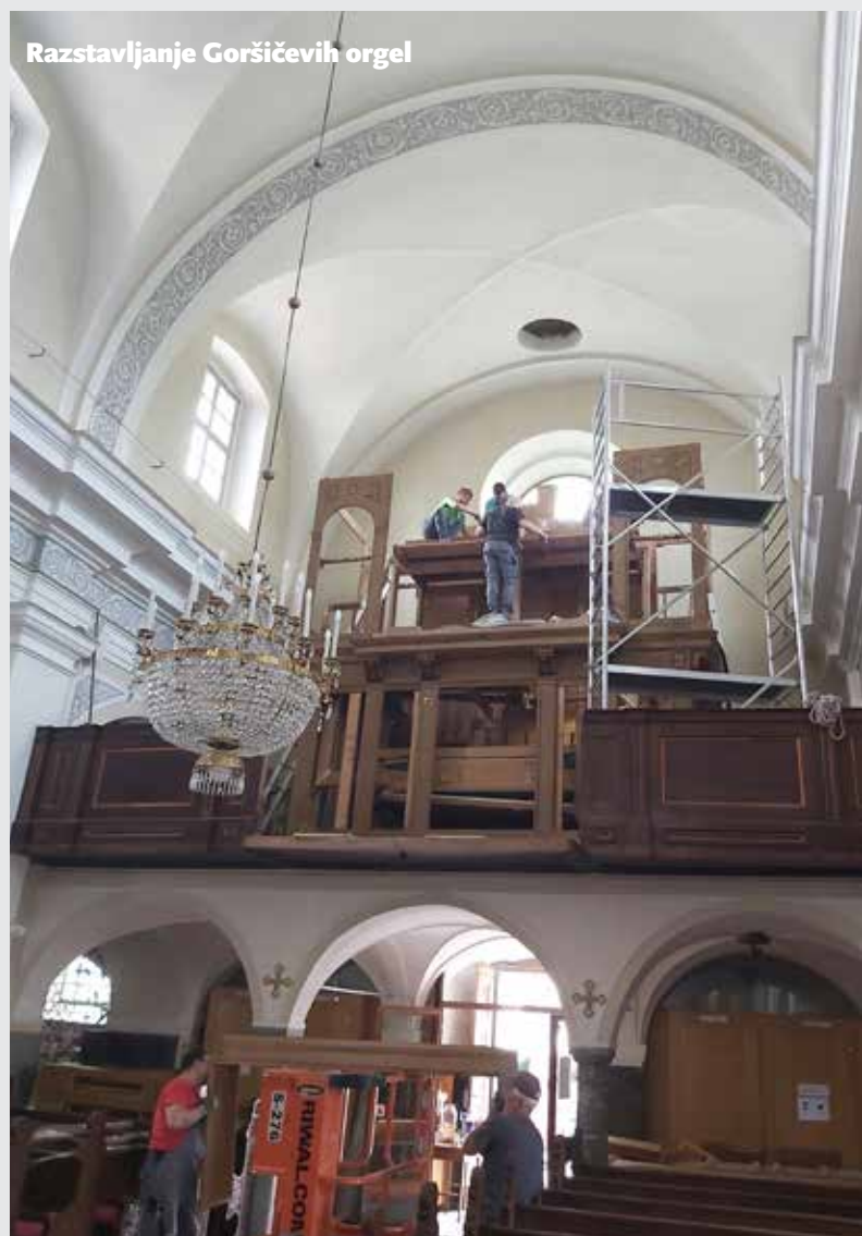
Razstavljanje Goršičevih orgel

Besedilo: Luka Posavec • Foto: Uroš Urbanija