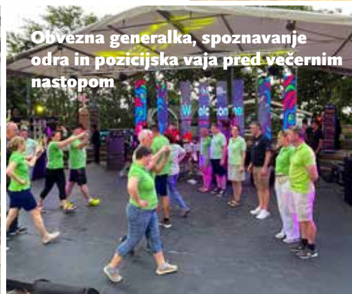
Obvezna generalka, spoznavanje odra in pozicijska vaja pred večernim nastopom