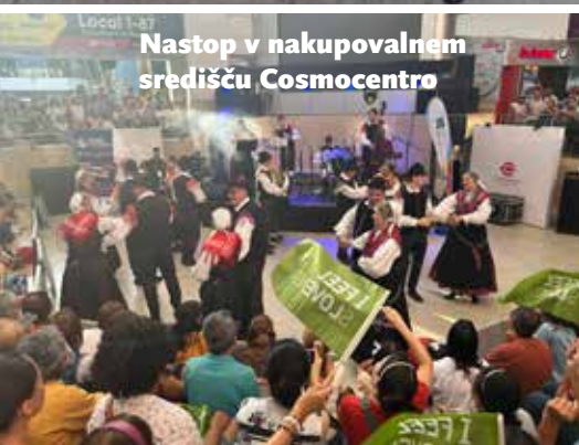
Nastop v nakupovalnem središču Cosmocentro