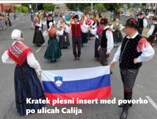
Kratek plesni insert med povorko po ulicah Calija