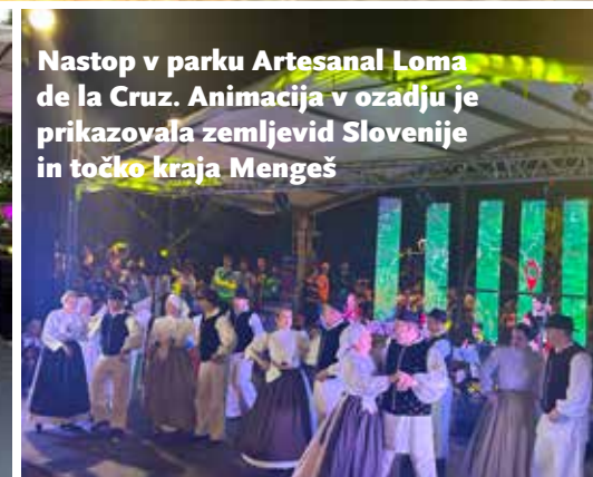
Nastop v parku Artesanal Loma de la Cruz. Animacija v ozadju prikazovala zemljevid Slovenije in točko kraja Mengeš