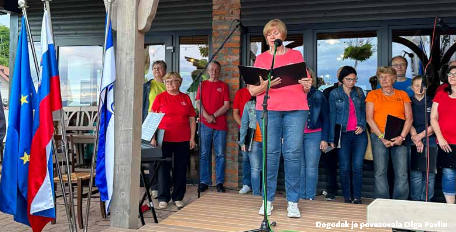
Dogodek je povezovala Olga Pavlin

Besedilo in foto: Barbara Kopač za Občinsko upravo