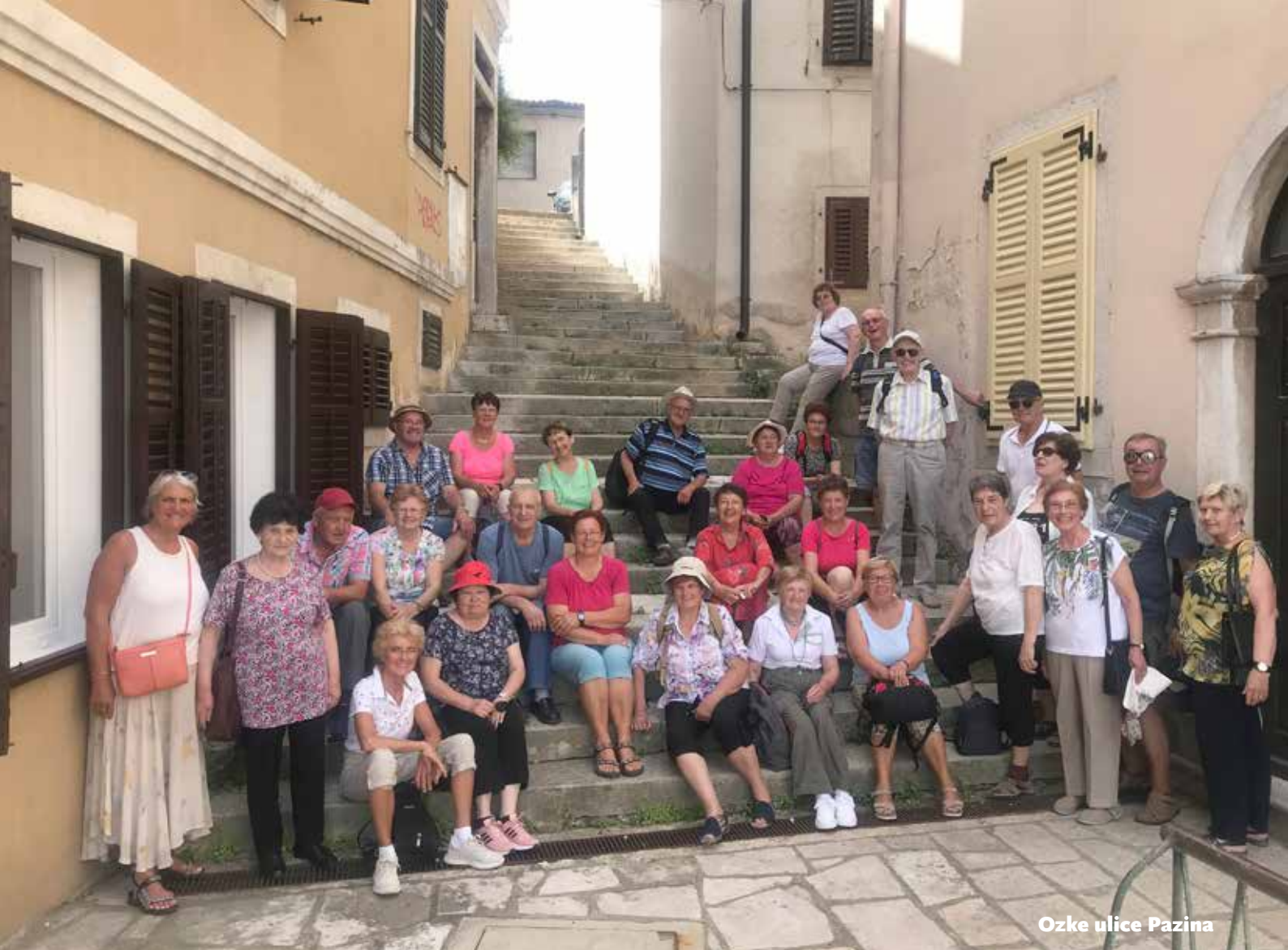
Ozke ulice Pazina