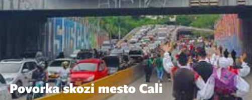
Povorka skozi mesto Cali