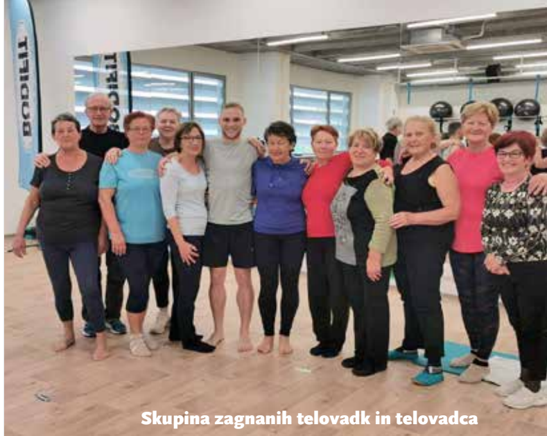
Skupina zagnanih telovadk in telovadca

Besedilo in foto: Nataša Vrhovnik Jerič za KD Antona Lobode