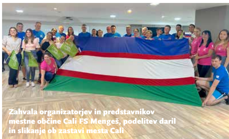
Zahvala organizatorjev in predstavnikov mestne občine Cali FS Mengeš, podelitev daril in slikanje ob zastavi mesta Cali