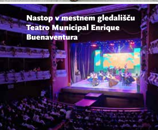
Nastop v mestnem gledališču Teatro Municipal Enrique Buenaventura