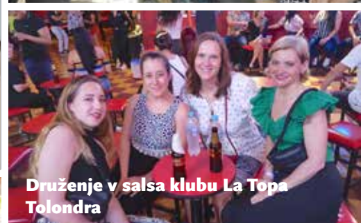
Druženje v salsa klubu La Topa Tolondra