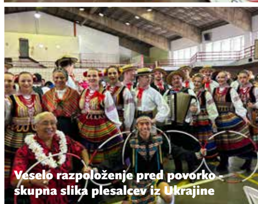
Veselo razpoloženje pred povorko - skupna slika plesalcev iz Ukrajine