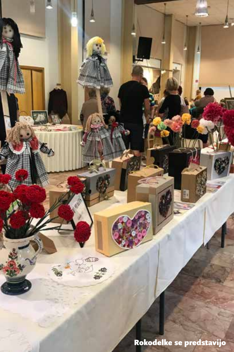
Rokodelke se predstavijo