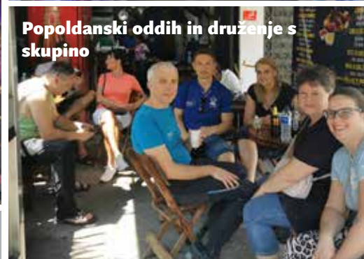
Popoldanski oddih in druženje s skupino