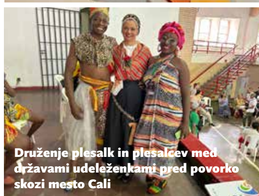
Druženje plesalk in plesalcev med državami udeleženkami pred povorko skozi mesto Cali