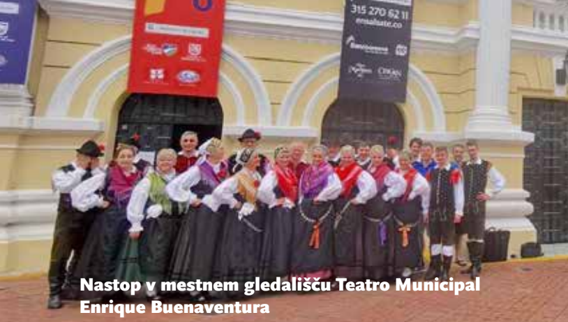
Nastop v mestnem gledališču Teatro Municipal Enrique Buenaventura