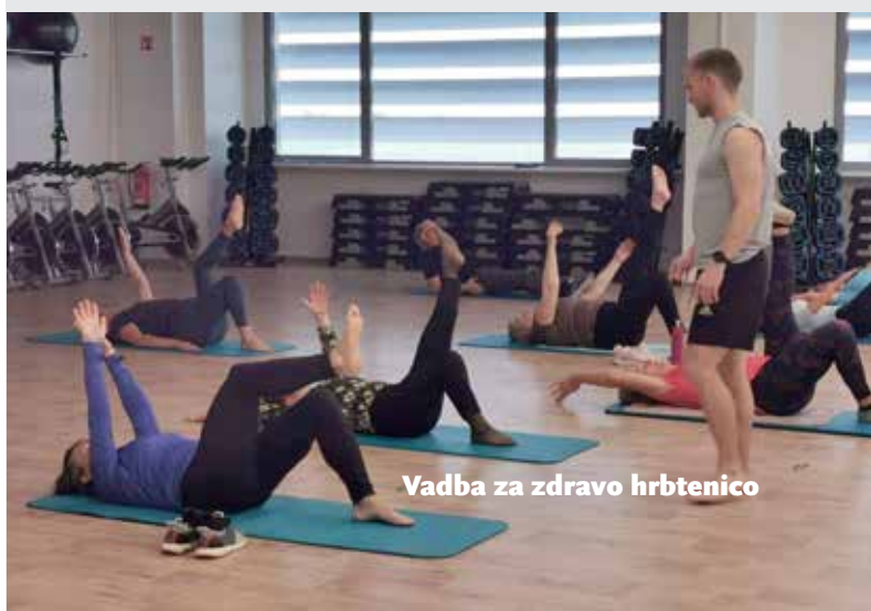
Vadba za zdravo hrbtenico