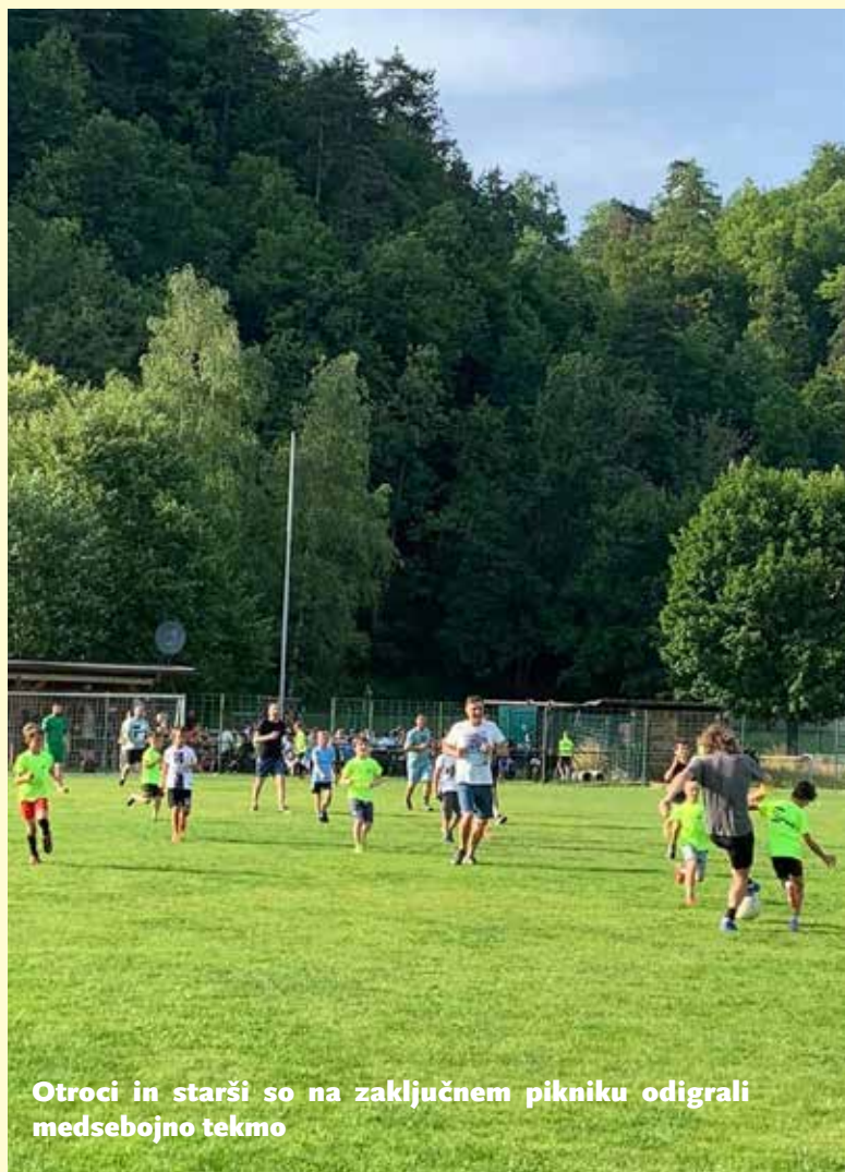
Otroci in starši so na zaključnem pikniku odigrali medsebojno tekmo