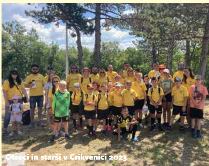
Otroci in starši v Crikvenici 2023

V mesecu juniju smo končali s sezono 2022/23. V zadnjem mesecu smo uspešno odigrali še vse tekme, ki so bile na sporedu ob zaključku sezone. Najbolj odmevna novica je nastop selekcije U8 na turnirju v Crikvenici, kjer so se pomerili proti največjemu hrvaškemu klubu GNK Dinamo Zagreb, prav tako so odigrali tekmo proti NK Rijeka.