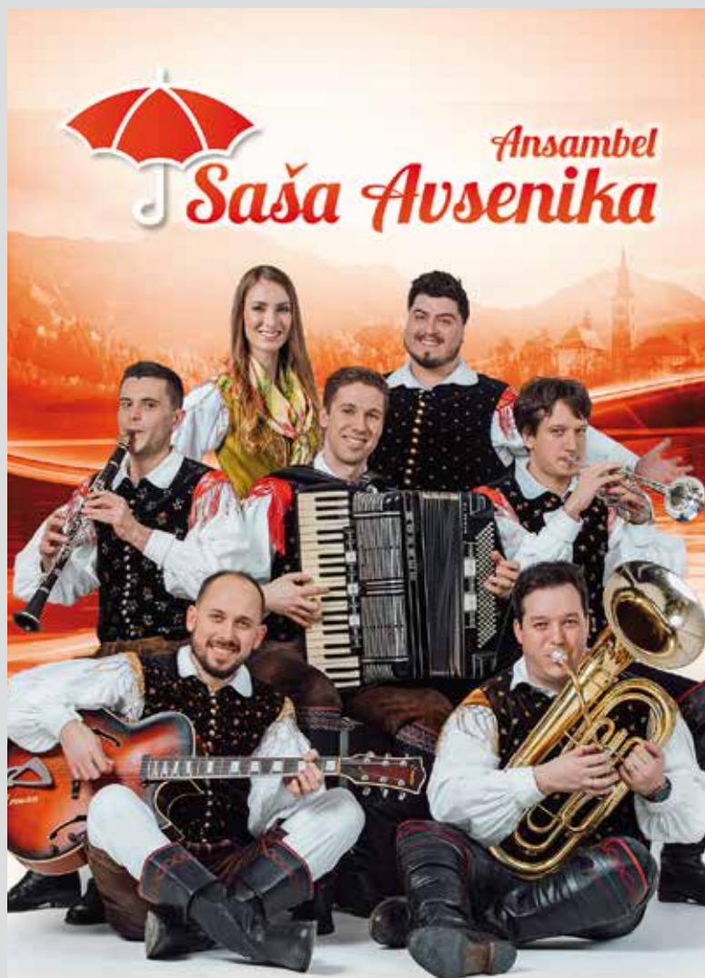
Ansambl Saša Avsenika vabi na veselico v Loki pri Mengšu