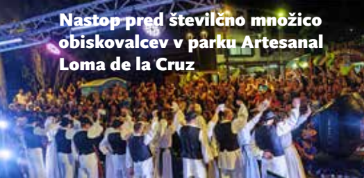
Nastop pred številčno množico obiskovalcev v parku Artesanal Loma de la Cruz