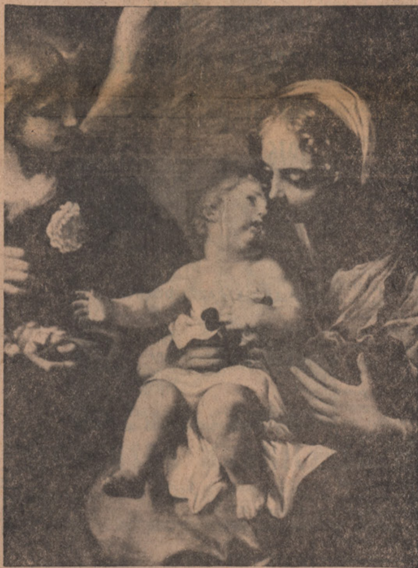
MATI Z DETETOM . . .