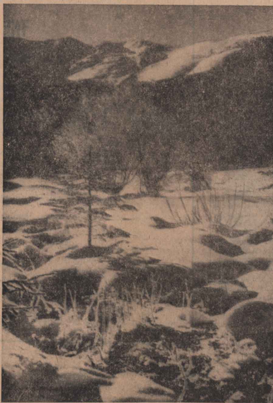
BOŽIČNA IDILA V PLANINAH . . .