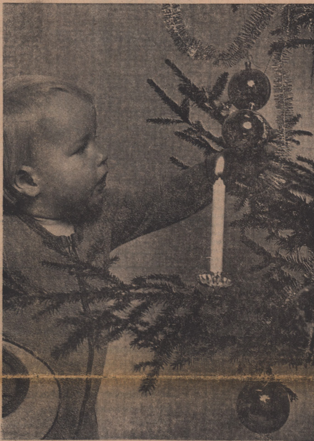
SVETA NOČ, BLAŽENA NOČ...

Desetič: Gibanje za neodvisno Slovenijo poziva tudi svobodne Slovence, ki žive kot begunci ali delavci v tujini, naj se vsak po svojih močeh zavzame za pravice koroških Slovincov, naj se čimbolj zanima zanje, kupuje njihov tisk, da bo informiran o njih in da ga bo tako podprl, naj obiskuje kraje na slovenskem Koroškem in naj tam v javnosti čim bolj ponosno poudarja svoje slovenstvo, kar bo v moralno oporo koroškim Slovincem. Predvsem pa jih tudi poziva, naj se priključijo gibanju za neodvisno Slovenijo, kajti tako bodo tudi največ storili za krepitev slovenskih manjšin vsepovsod.