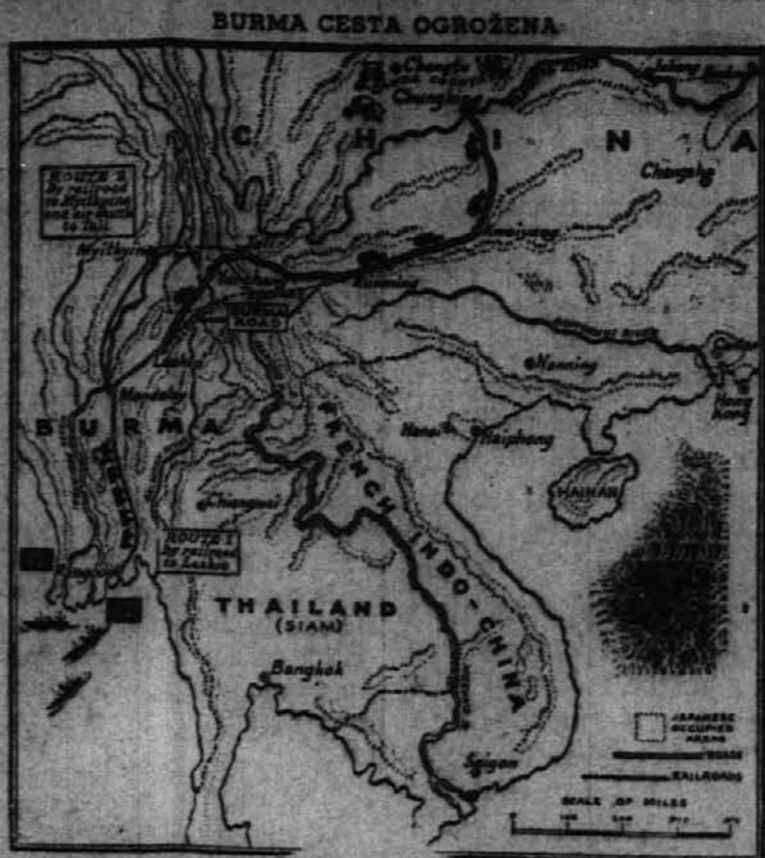
Takovsani "Burma Road", ki je bila še edina pot, po kateri so se moglo od sunaj pošiljati Kitajski zaloga, je zdaj resno ogrožen od Japoncev, ki pridirajo v Burmo od vzhoda, iz Thailanda.