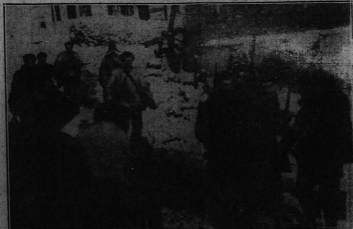
Kjerkoli se po umiku nazijske vojske, jih prebivalstvo z veseljem pozdravlja kot osvoboditelje. Gornje slika kaže, ko so sovjetski gverilniki zasedli zadaj za nemško fronto neko vas ter jo držali, dokler niso prišle redne ruske čete.

Ob bivanju grofa Ciana v Budimpešti je fašistični list "Resto del Carlino" priobčl članek, kjer med drugim pravi, da se mora Madžarska tesneje okleniti držav osiše in se boriti proti Rusiji, kajti z rusko zmago bi se utegnili okoristiti tudi drugi Slovani. Z njihovo zmago bi nastale v Madžarski ne samo socialne spremembe, temveč bi jo Slovani popolnoma uničili. To je bil opomin Madžarski, naj se pokori nemško-italijanskemu ukazu in pošlje svojo vojsko za vzdrževanje rensanskem Novem ukazal, naj da v Srbiji.