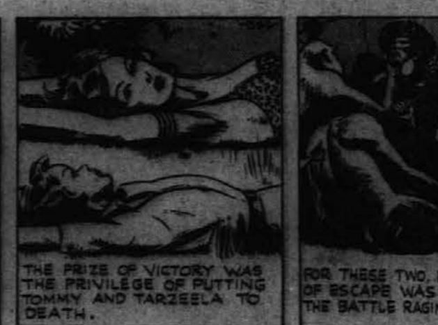
The prize of victory was the privilege of putting Tommy and Tarzela to death.