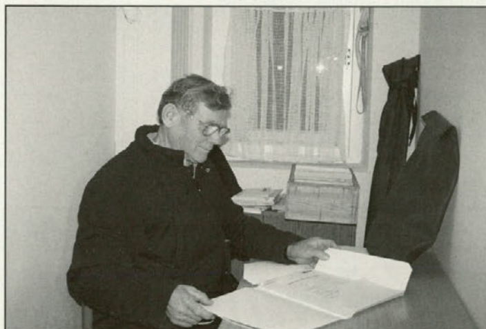
V društvu so posebej ponosni na novo preurejen prostor, kjer se pogosto dobivajo.

V septembru na izletu, v decembru druženja doma S prijetnimi vtisi so se v septembru z izleta vrnili selski upokojenci, ki so samo v enem dnevu obiskali skorajda vse večje znane kraje na Gorenjskem, v upokojensko družbo pa so vzeli tudi svojih 12 vnukov, da je bila družba vsaj po letih nekoliko mlajša.