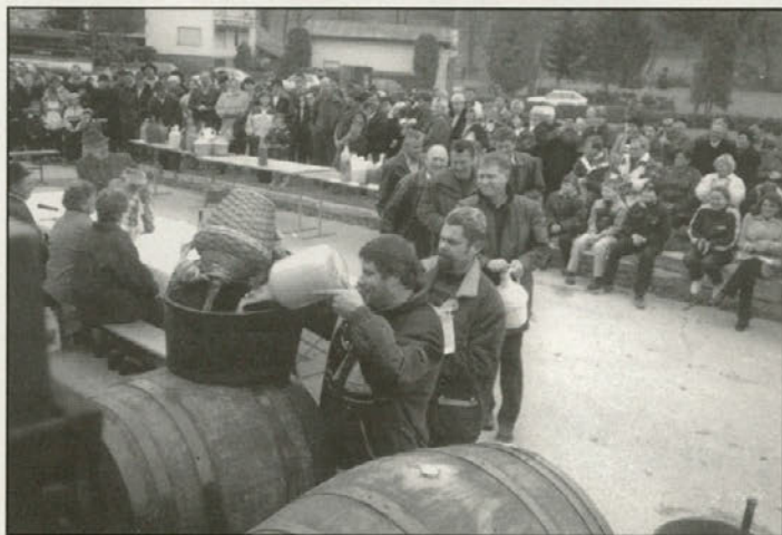
Skupina iz Repišč prinaša svoj delež.