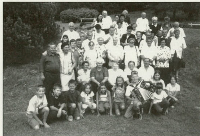
V spomin na nepozabno druženje ...

predsednik DU Sela. Društvu je zdaj zvestih že blizu 80 članov, imajo svoj prapor, od letos pa tudi društveni prostor v selskem gasilskem domu, kar bodo v kroniko zapisali kot velik uspeh.