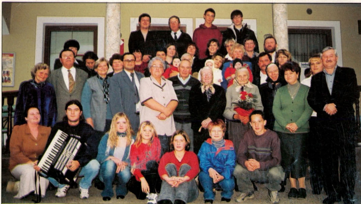
In še skupen posnetek, ki bo vsem skupaj ostal v lepem spominu.