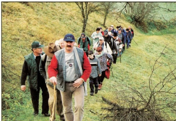
Lepa narava je vplivala tudi na počutje pohodnikov.