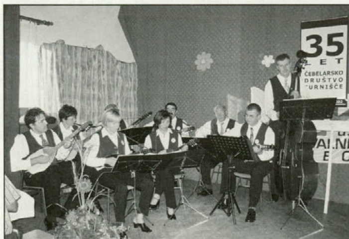
Tamburaši so popestrili večer čebelarjem ob njihovi 35-letnici.

V zvezi z odločanjem o videmski občinski zvezi kulturnih društev so se predstavniki kulturnikov iz naše občine že sestali, se seznanili z dejstvi in sedaj morajo po društvih skleniti, ali so za svojo občinsko zvezo ali ne. Pravzaprav jim kdove kakšno razpravljanje ne preostane, kajti če ptujska ZKD noče nemestnih društev, ker tudi financirana ni iz drugih okolij, bodo društva za boljšo koordinacijo z državno zvezo kulturnih društev primorana ustanoviti občinsko zvezo. Ne nazadnje bo občinska zveza najbrž lažje nastopala s svojimi pričakovanji in zahtevami do občinskega sveta in proračuna, iz katerega društva dobivajo večino denarja za svoje delo, zveza bo najbrž tudi prevzela nevhvaležno nalogo razdelitve proračunskih sredstev med svoje članice (za kar bodo ti najbrž lažje pripravili pravilnike, kot pa bi jih na občini, saj kulturniki svoje delo in potrebe najbolj poznajo), tudi kakšna priznanja kulturnikom bo zveza najbrž morala ustanoviti, pripraviti koledar občinskih prireditev ... Skratka dela zanjo bo več kot dovolj.