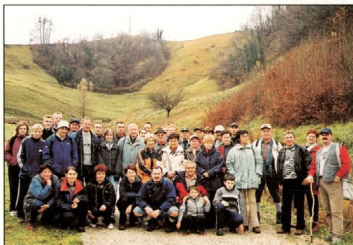
Na koncu pa še skupinski posnetek

Pohodniki smo pričeli pot pri Pernekovi kapeli v Veliki Varnici. Pot smo zastavili tako, da nas je vodila na najvišji vrh v osrednjih Halozah. Ves čas pohoda nam je družbo delal dež in megla, zato je bila pot še bolj prijetno težka in očarljiva, saj smo zvon iz cerkve sv. Avguština zaslišali mnogo prej, kot zagledali zvonik. Po prihodu na vrh smo si ogledali notranjost cerkve sv. Avguština in sv. Magdalene.