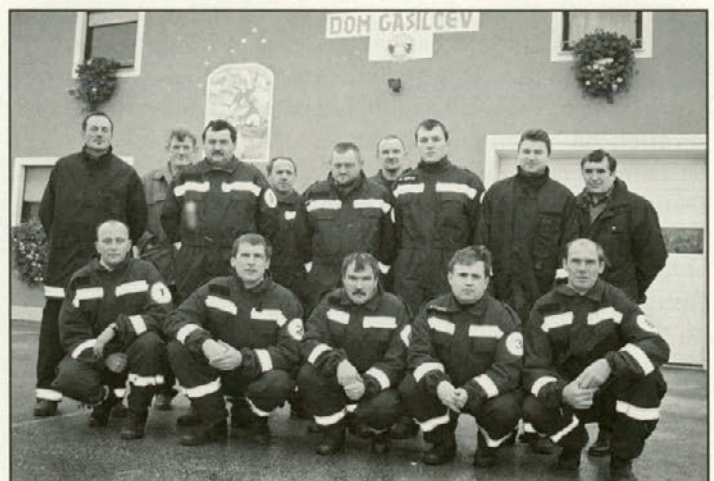
Člani PGD Tržec

Ob tej priložnosti bi se vsem in vsakemu zahvalili za izkazano pomoč in vzpodbudo, da naše društvo lahko deluje vzorno in zgledno. Ker pa se leto končuje bi vsem krajanom in občanom občine Videm zaželeli vesele BOŽIČNE praznike in srečno, zdravo in uspešno NOVO LETO 2003.