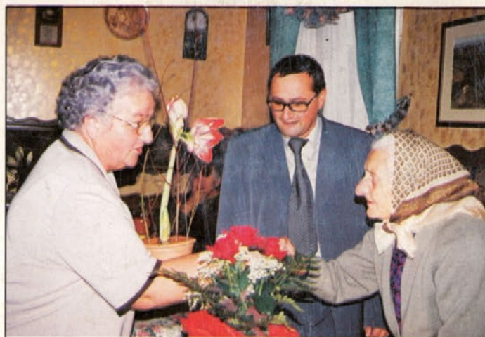
Čestitke ob visokem jubileju.