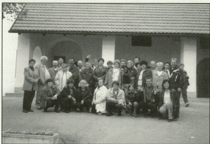
Pred cerkvijo v Bogojini

Lepo nedeljsko jutro 27. oktobra ob 7. uri zjutraj. Člani Turističnega društva KLOPOTEC Leskovec smo se zbirali ob avtobusu, ki nas bo v naslednjem trenutku popeljal na poučni izlet v Prekmurje. Izlet je bil neke vrste nagrada za vse, kar smo v društvu postorili v odhajajočem letu 2002 in hkrati zaključek še enega uspešnega leta. Veliko dela, odmevnih prireditvev, truda, časa in še česa je bilo vloženo v aktivnosti, ki so pripomogle k razpoznavnosti in dvigu ugleda našega društva.