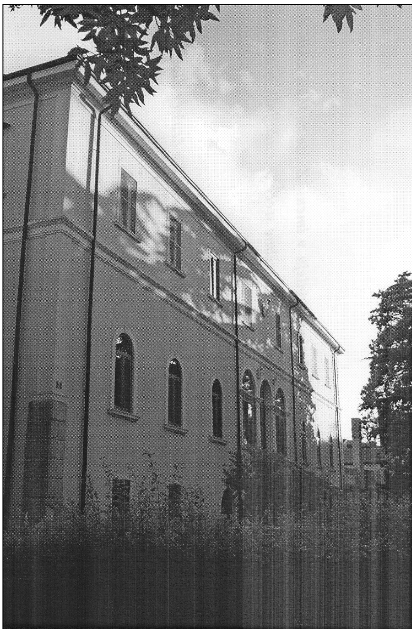
Sl. 2: Škofijska palača v Kopru (1890). Fig 2: Diocesan Palace at Koper (1890).