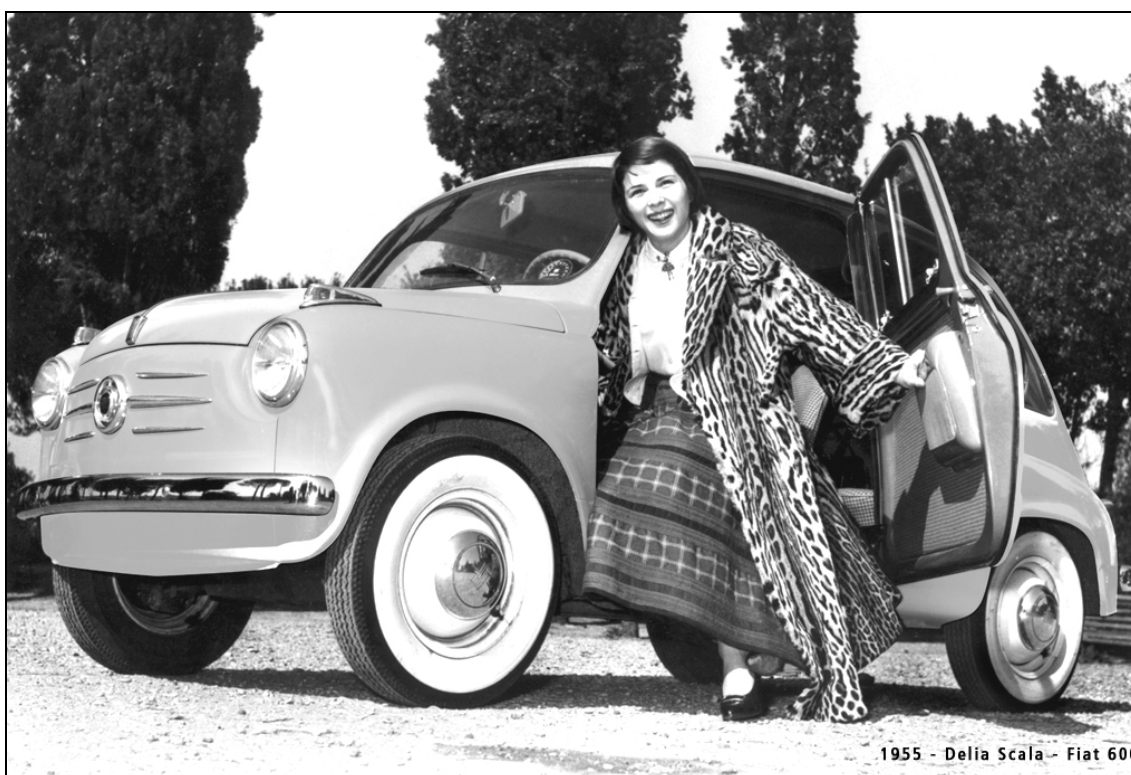
Sl. 1/ Fig. 1: Fiat 600 (1955).

(ej) nula – bog ne daj da greš na internet am pazit moraš kaj govoriš ... ej nula ; ita. non permettersi nulla , v pomenu nič si ne privoščiti