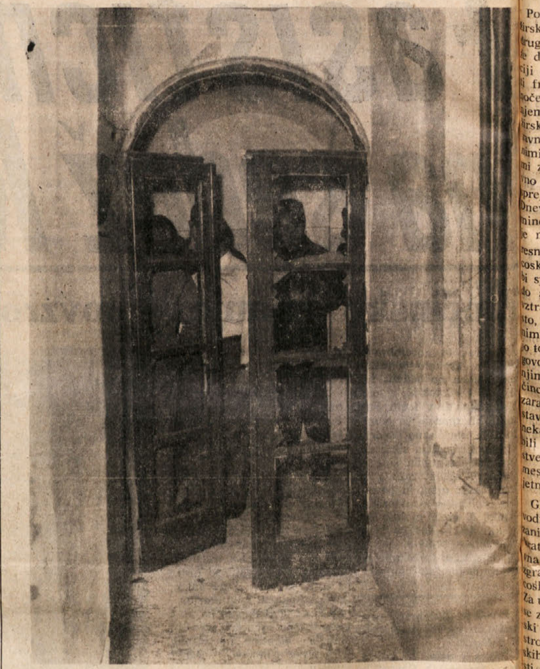
Vhod v sedež sekcije «Tomažič»

Se pred temi fašističnimi atentati so bili izvedeni podobni atentati tudi v Bologni. V Parmi so fašistični