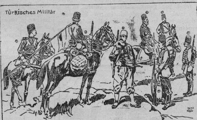
1. Ulan, 2. Dragoner, 3. Albanischer Infanter, 4. Nizam Inf., 5. Fuss-Artillerie, 6-7. Gen.St. Offizier.

Turčija je imela vedno hude notranje boje. Prejšnji njeni vladarji, zlasti bivši sultan Abdul Hamid so si domišljavali, da so še vedno nekaki azijski poglavari. Zato so zapirali državo pred vsakim zunanjam, modernim evropskim vplivom. Vkljub temu, da ima Turčija pravzaprav velikanske moči združene, jih pod starim režimom ni mogla in ni hotela izrabljati. Ko so potem prišli Mladoturki do vlade in so nazadnjaškega sultana pregnali, pričeli so seveda v kratkem času z vso naglico državo modernizirati. Poklicali so iz Nemčije oficirje in vojaške strokovnjake, ki so armado popolnoma reorganizirali in izvežbali. Tako se zamore turška armada danes z velikim nasprotnikom meriti. Naša slika kaže glavne vrste vojakov Turčije (zgoraj) in Italije (spodaj). Zgoraj (pri Turkih) vidimo od leve na desno: 1. ulanca, 2. dragonca, 3. albansko infanterijo, 5. pehotno artiljerijo, 6. in 7. pa generalne stabne oficirje. — Pri Italijanih (spodaj) vidimo: 1. infanterista, 2. infanterijskega oficirja, 3. bersaglieri-vojaka, 4. planinskega lovca, 5., 6., 7. in 8. mornarske vojake, oficirje in mornarje, 9. kavaljerista, 10. stabnega oficirja in 11. artiljerijo.