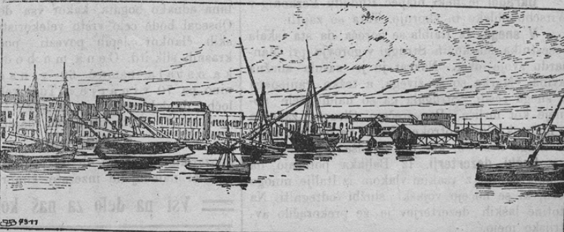
Ansicht des Hafens von Prevesa.

Kakor znano, je v celni italijansko-turški vojni najvažnejše vprašanje je-li bode Italija svojo vojko tudi v Evropo zanesla. Kajti to bi pomenilo hudo vznemirjenje tudi za ostale velevlasti, zlasti za Avstro-Ogrsko. Deloma so tozadevna poročila že prišla. Zlasti se gre tukaj za turško provinco Albanijo, katere glavno pristanišče je mesto Prevesa. To mesto so Italijani baje že pričeli bombardirati. Naša