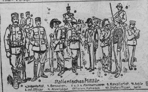
1. Infanterist, 2. Bersaglieri, 3. 6, 7. & Marinestruppen, 9. Kavallerist, 11. Artillerie, 2. Inf. Offizier, 4. Alpenjäger, Offiziere, Matrosen, 10. Stabs-offizier, 10. Lerie.