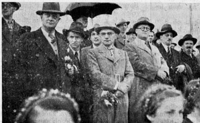
Ptujski tabor: Ministra dr. Krek in dr. Rogič v spremstvu odličnih zastopnikov med slavnostnim zborovanjem.

Minister dr. Krek je nato posegel v zgodovino in govoril o Celju in Ptuj, o mestih, ki sta bili središči ponemčevanja med Slovenci ter nato nadaljeval: Danes zaključujemo v Ptuj prvo uvodno