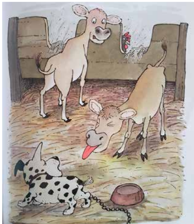
Slika 2: Psiček Pafi v hlevu. Ilustracija: Marjan Manček.

Vir: Kovač, P. (2014), Težave in sporočila psička Pafija . Ljubljana: Mladinska knjiga.