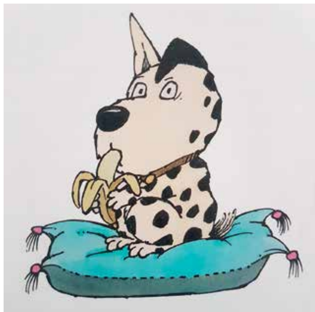
Slika 1: Psiček Pafi na blazini. Ilustracija: Marjan Manček.

Na drugi sliki je glavni literarni lik prikazana v hlevu, kjer je privezan na verigo. Okoli njega so kokoš in dva telička. En teliček psičku kaže jezik, psiček pa nanj laja. Učenci so se v parih pogovorili o sliki. Ponovno sem jim naročila, da naj opazujejo psička in razmišljajo, kako se počuti in zakaj. Vsi učenci v razredu so ugotovili, da je psiček na sliki isti kot na prejšnji, saj je bel s črnimi