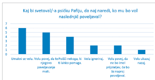
Graf 1: Kaj bi svetoval/-a psičku Pafiju, da naj naredi, ko mu bo vol naslednjič poveljeval?

Šest jih je predlagalo, da naj se volu umakne , pet jih je napisalo, da naj volu pove, da ga njegovo poveljevanje