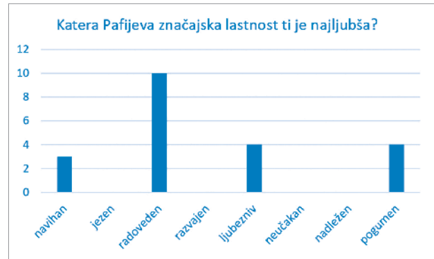
Graf 2: Katera Pafijeva značajska lastnost ti je najljubša?

Drugo vprašanje je učence spraševalo po značajski lastnosti Pafija, ki jim je najljubša. Učenci so se morali odločiti med osmimi značajskimi lastnostmi.