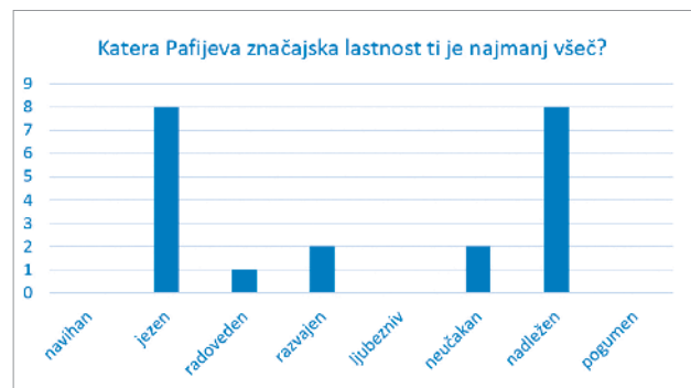
Graf 3: Katera Pafijeva značajska lastnost ti je najmanj všeč?

Tretje vprašanje je bilo zasnovano na podoben način, le da je učence spraševalo po značajski lastnosti literarnega lika, ki jim je najmanj všeč.