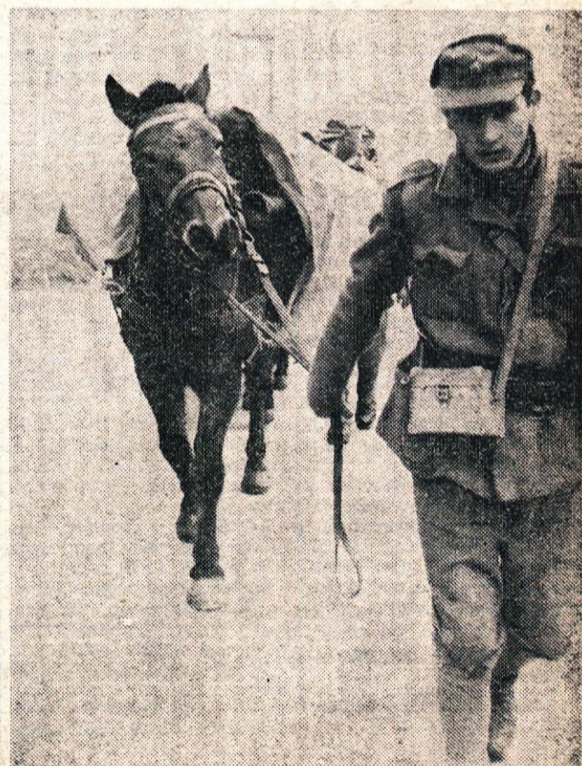
Ne mraz, ne »plavice« niso mogli do živlega naših pogumnih vojski na vajah »JESEN 77«.