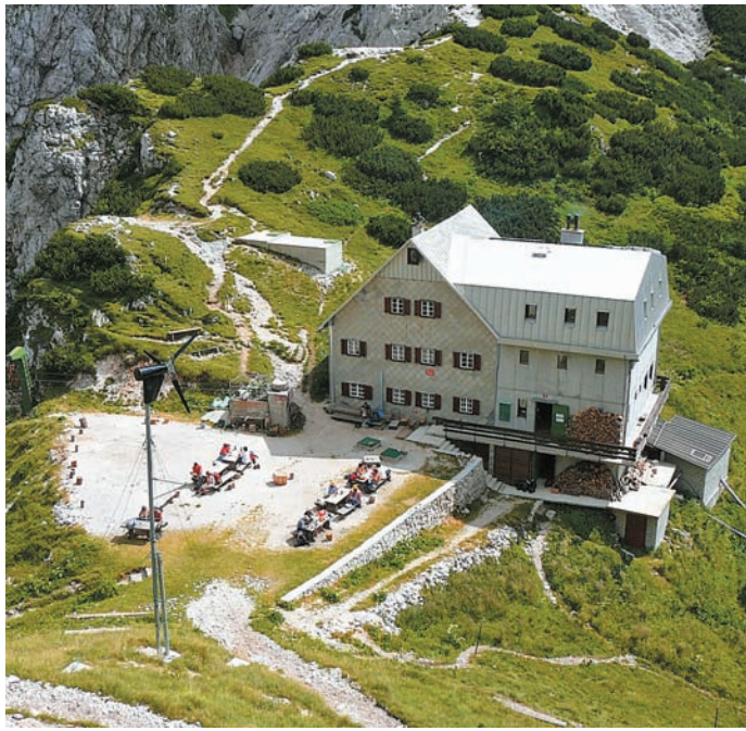
Cojzova koča na Kokrskem sedlu.

V letu 1983 je PD Kamnik prvič priredilo srečanje svojih članov in ljubiteljev Kamniških planin na Kamniškem sedlu. Planinstvo je v svoji osnovi individualna dejavnost, ki se izvaja posamezno, predvsem pa v manjših skupinah. V drugi polovici prejšnjega stoletja so bile popularne tudi množične akcije, kot npr. 100 žensk na Triglav in podobno, vendar prireditelji »Dan kamniških planin« že takrat ni spadala mednje, čeprav bi na prvi pogled lahko. Kot se člani PD enkrat na leto zberejo v dolini na občnem zboru, tako je bila osnovna zamisel te prireditve, da bi se enkrat na leto zbrali tudi v središču svojega delovanja, torej v planinah. In to svojo tradi-