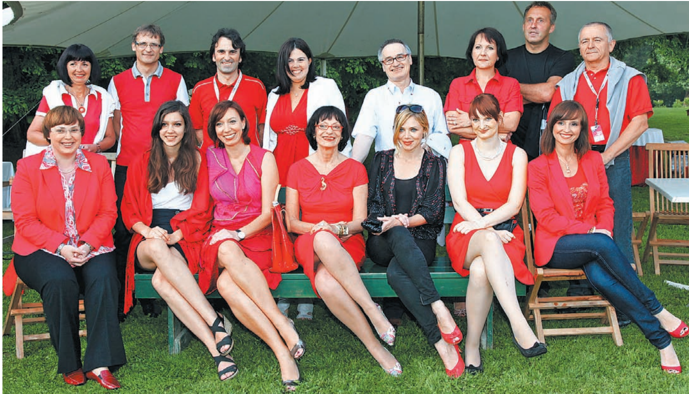
Vrhunski glasbeni dogodek v Arboretumu Volčji Potok je imel pomenljivo noto dobrodelnosti. Akciji »Obleci me v rdeče« Društva za zdravje srca in ožilja Slovenije so se pridružile ambasadork »v rdečem« in »zaslužni« za izvedbo dobrodelnega glasbenega sladokusja.

Več o programu si preberite v NAPOVEDNIKU DOGODKOV!