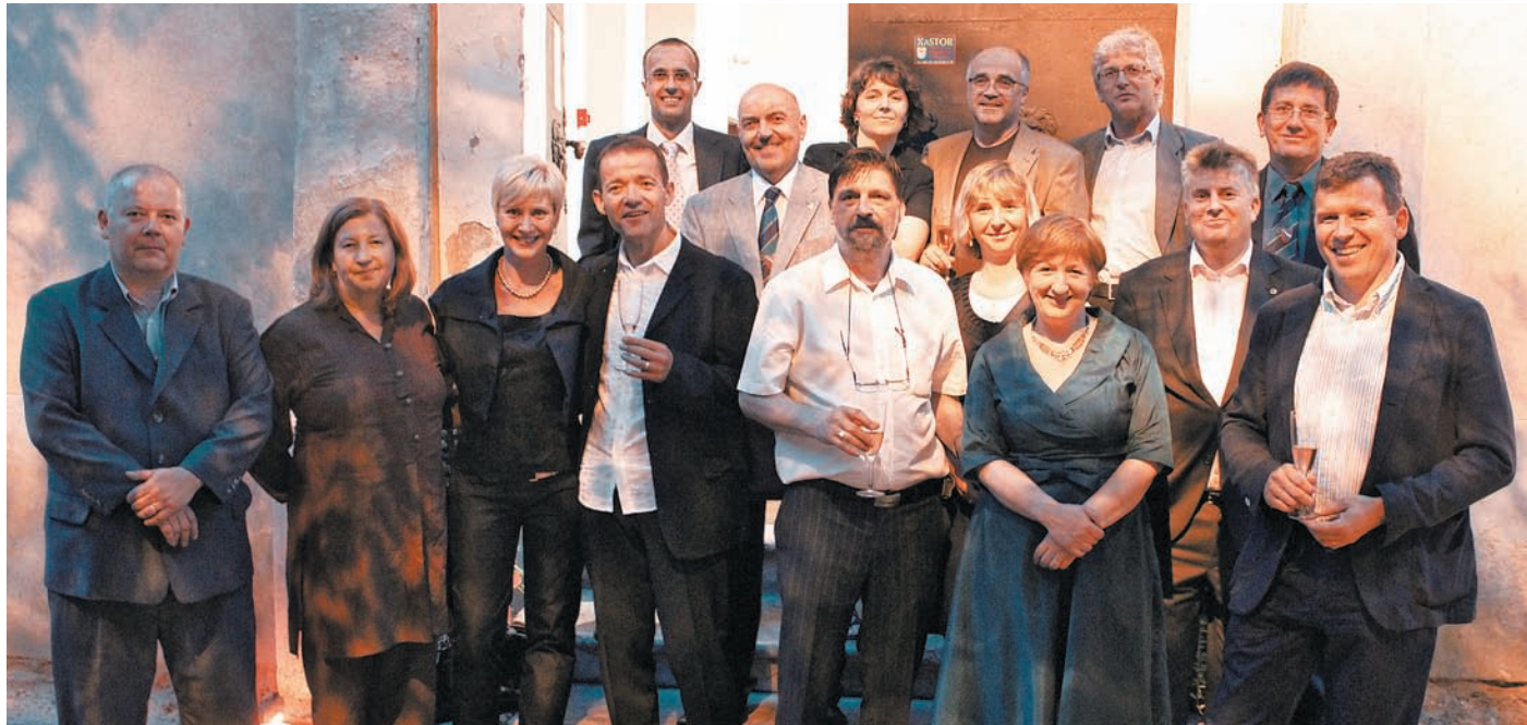
Kamniški Lions klub na praznovanju obletnice ustanovitve.

Kamniški Lions klub deluje že sedmo leto in v svojih vrstah združuje člane in članice, ki so se opredelili za dobrodelno dejavnost in pomoč ljudem v stiski.