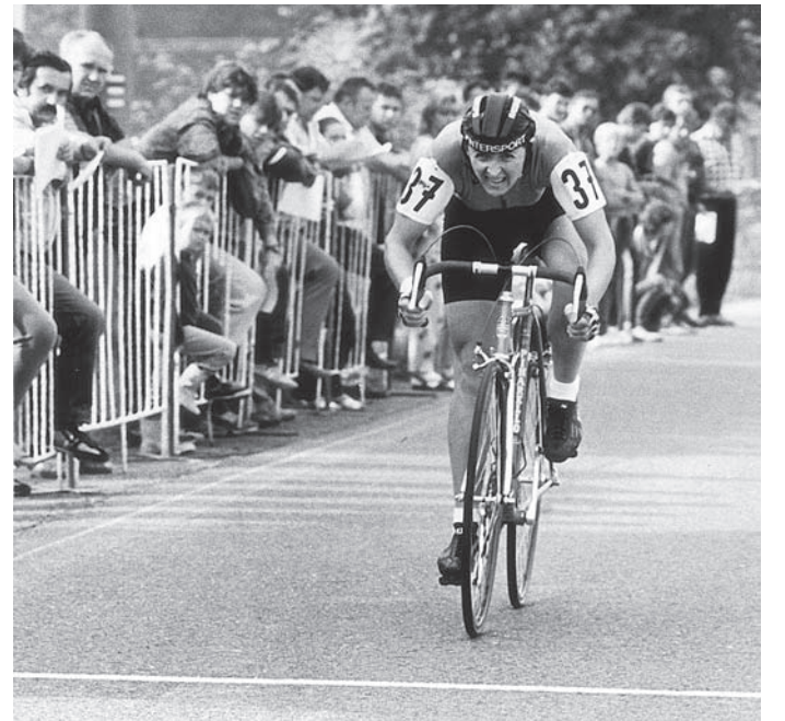
Vida drvi na vrh, novi zmagi naproti...