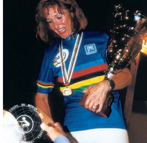
Najboljša slovenska kolesarka vseh časov je tudi štirikratna svetovna veteranska prvakinja; na sliki s pokalom v St. Johannu v Avstriji leta 1993.

V času mojega profesionalnega kolesarjenja je bila organizacija ženskega kolesarstva v Sloveniji izredno slaba. Posluha za ženske in dirkanje praktično ni bilo. Za skoraj vse, kar je vendarle bilo, je bil služen moj mož. Petnajst let je bil selektor slovenske kolesarske ženske reprezentance, pa tudi naš trener, šofer, mehanik, manager. V začetku sem tekmovala le v Sloveniji, začetki so bili bolj skromni in nestrokovni, od leta 1985 pa sem se skupaj z drugimi slovenskimi kolesarkami udeleževala tekmovalj po takratni Jugoslaviji in tujini – Franciji, Nemčiji, Avstriji, Madžarski, Češkoslovaški in Italiji. Če hočeš dirkati, moraš v tujino. Tako je bilo in tako je tudi danes.