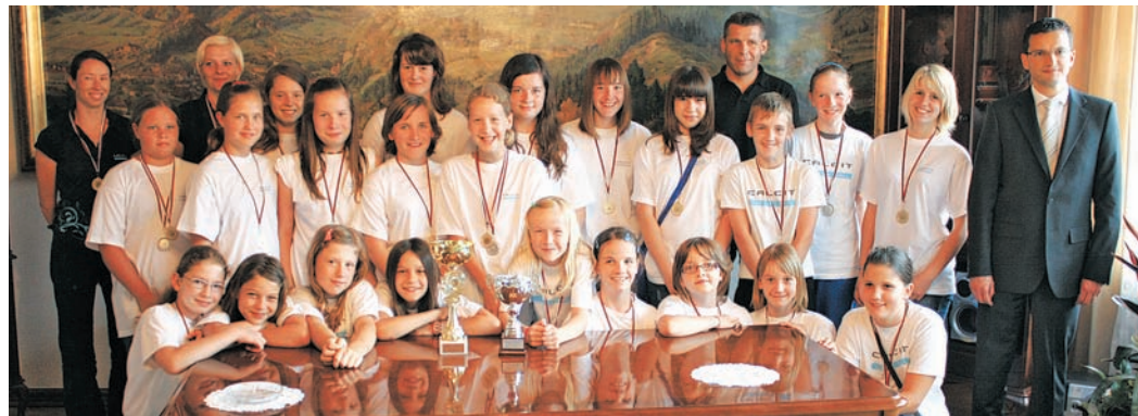
Kamniški župan Marjan Šarec pa je prejšnji teden sprejel izjemni kamniški ekipi deklic v mini in mali odbojki. Župan Marjan Šarec jim je iskreno čestital in jih spodbudil k nadaljnjim uspehom. Tako kot dečki v mini odbojki so tudi dekleta prejela skromno darilo - nepozabno zabavo na paintball poligonu v Kamniški Bistrici na Kraljevem hribu, kjer se bodo sedaj lahko pomerila proti fantom.