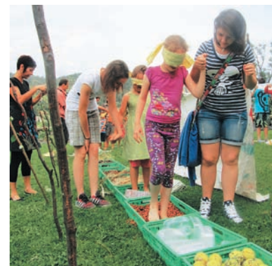
Mladi so se pridružili Reciklarjem, ki so jih popeljali na raziskovanje in odkrivanje čutov skozi izgubljeni labirint.