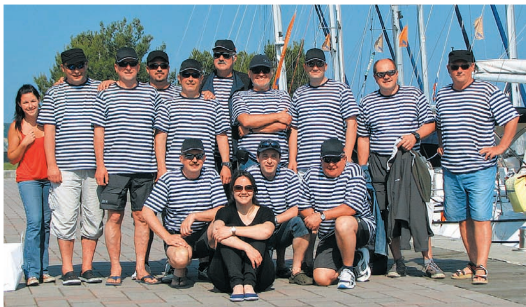
Nepozabno izkušnjo so učencem osnovne šole Cirius Kamnik pripravili mornarji in skiperji ŠD Sappa iz Kamnika.