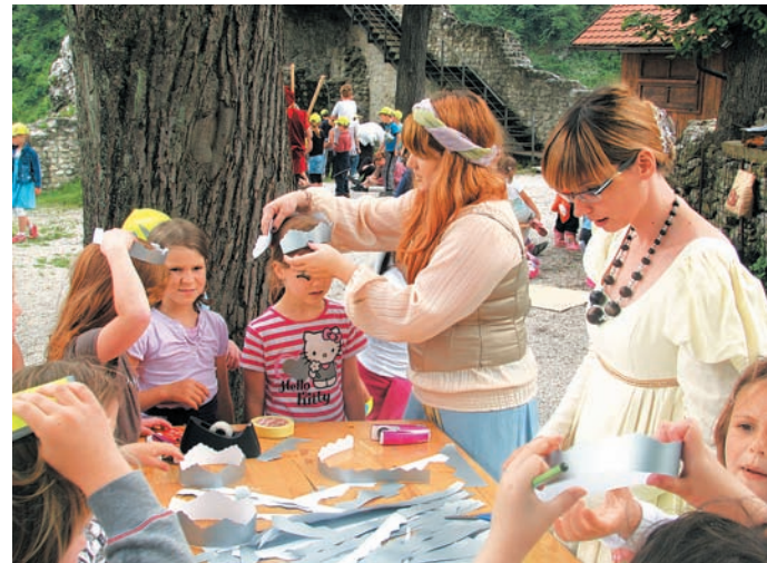
Poletni sobotni dopoldnevi na Malem gradu so rezervirani za Veronikine delavnice za otroke.

URŠA OSOLNIK Agencija za turizem in podjetništvo Kamnik