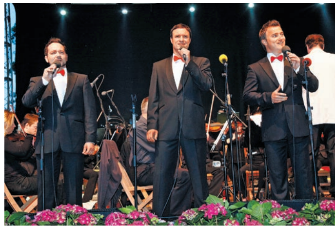
Tako, kot vselej, so navdušili tudi v Arboretumu Volčji Potok – Eroika.

Glavni partner dobrodelnega koncerta, Skupina KD Group, je preko svoje ustanove KD Fundacija podarila donacijo v višini 5.000 evrov, namenjenih za nakup lutk za izvajanje tečajev temeljnih postopkov oživiljanja in za izvedbo tisoč brezplačnih preventivnih meritev za ženske