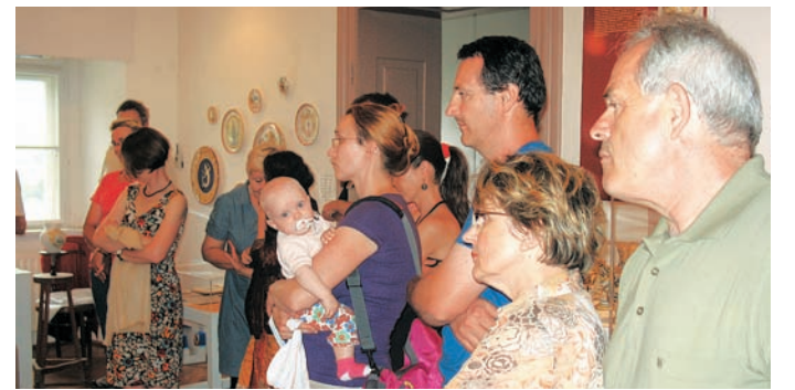
Javne vodstva po razstavah so se obiskovalci z zanimanjem udeležili.

Tudi letos - v soboto, 18. junija, se je Medobčinski muzej Kamnik pridružil osrednji vseslovenski akciji, ki skuša muzejske dejavnosti na priljuden način približati široki zainteresirani javnosti. Obisk je bil nad pričakovani, prireditve dobro obiskane in izvedene na kvalitetni ravni in z veliko mero entuzijazma.