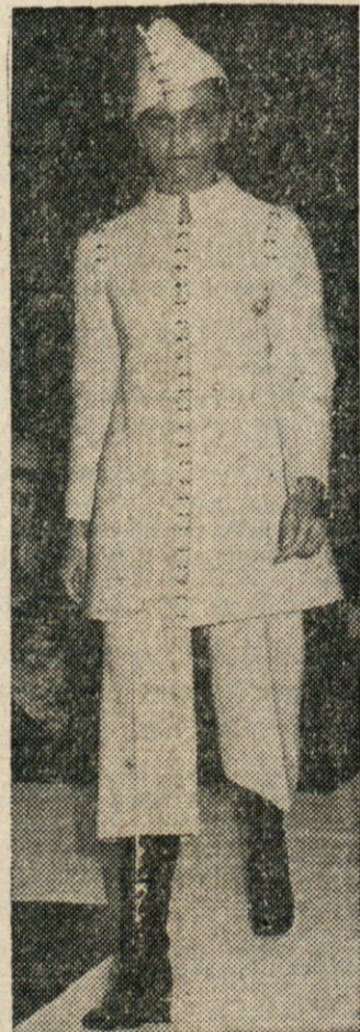
NEHRUJEV KROJ — Ponekod prihaja v modo "Nehrujev" kroj, kot ga vidimo na sliki. K visoki zapeti, dolgi jopi, hlačam in kapi, spadajo tudi škornji.