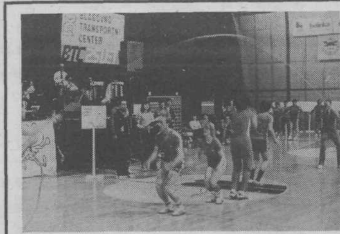
Ena od disciplin je bila tudi skakanje čez vrv.