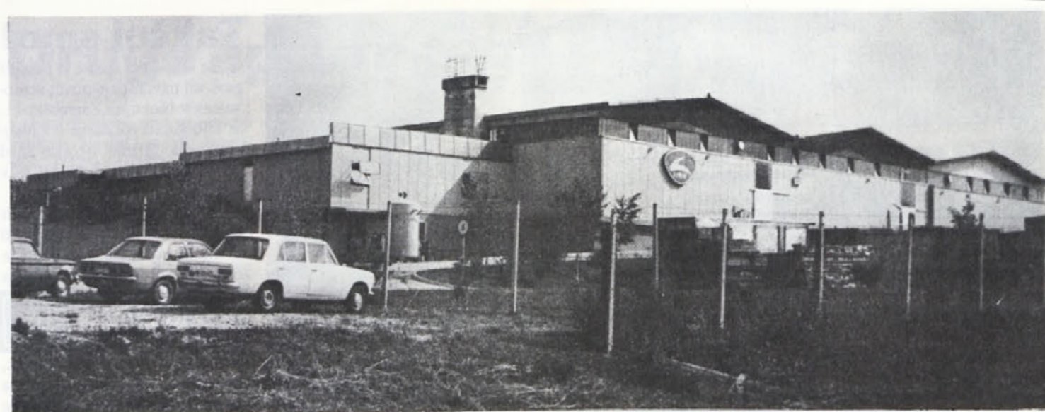
TOZD v Šmarjeti izdeluje okna in kovinsko galanterijo. Pridnih rok je dovolj, le dragega, uvoženega pleksija ni vedno dovolj...

Ta cvetlična greda pred vhodom v tovarno je sama pripravila do tega, da smo napravili vrtarski dvorišče. V Šmarjeti delavci kar sami poskrbijo, da je njihovo delovno okolje prijetejše.