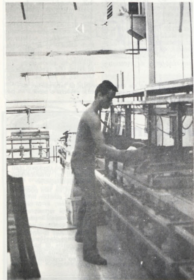
Peči imajo v Šmarjeti le dve in za enkrat sta prav ti dve ozko grlo v proizvodnji.

V lepilnici, kjer lepijo okna, je zrak močno nasičen z različnimi kemičnimi hlapi. Poleti so odprta vrata najboljši ventilator, pozimi pa zrak čistijo klima naprave.