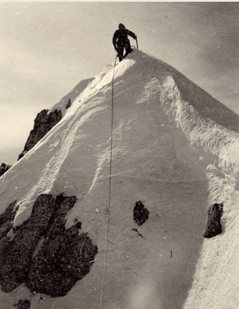
Na zasneženem vrhu

Razlog bi lahko bil v značilnosti medvojnega obdobja – to je popolnoma ločen razvoj alpinizma v Julijskih in Kamniško-Savinjskih Alpah. Posamezne naveze so se specializirale za določeno območje in obdelovale izključno "svoj vrtiček". Kaj se je dogajalo drugje, jih ni niti zanimalo, sploh pa ne motiviralo.