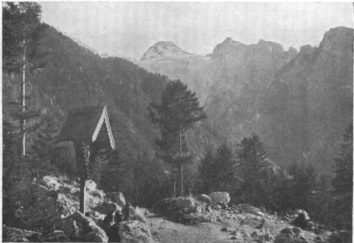
Razór iz Trente.