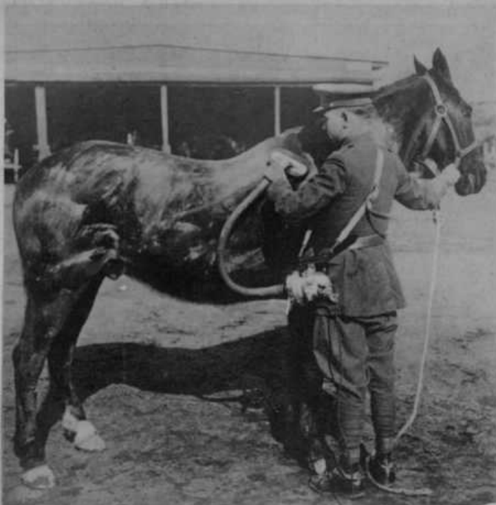
V Ameriki dela vse elektrika. Tudi snaženje konj v ameriški armadi se vrši električno. Vojak drži v roki „štrigelj“, ob ledju pa mu visi zračna sesaljška, ki jo žene električni motorček. Sesaljška pobere s kože ves prah, ter ga po cevi sproti odnaša v prostor poleg sesaljške, odkoder ga vojak po storjenem delu odstrani. — Priprava je podobna električni meli, ki je tudi že pri nas zelo v rabi.