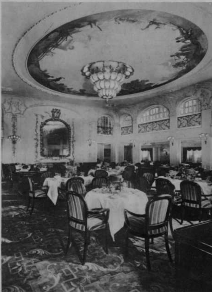
Obednica na novi največji hamburški ladji „New York“, ki je 1. aprila prvič nastopila pot preko oceana v Ameriko.