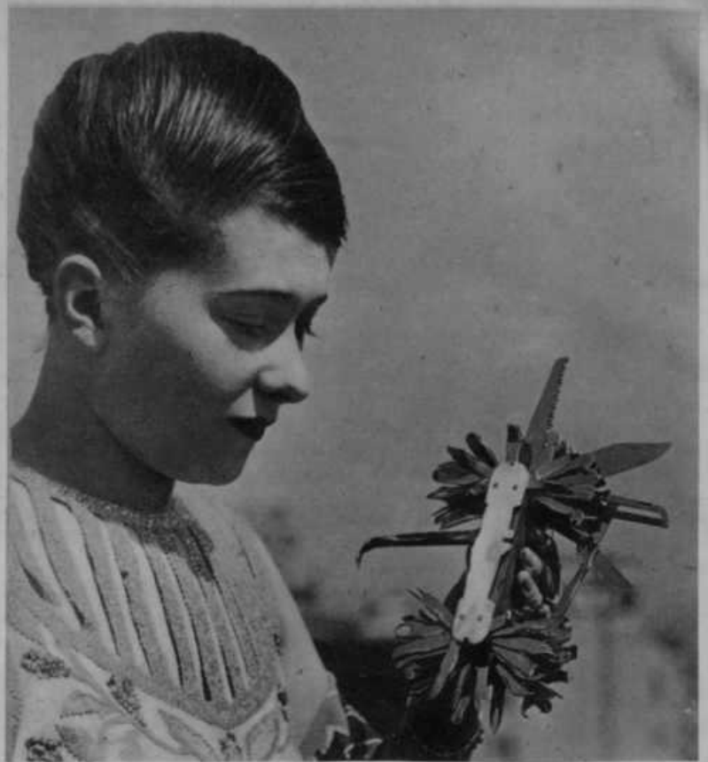
Neka kalifornijska (Amerika) firma v Los Angeles je izdelala nož s 100 klinami za vse vsakdanje potrebe.