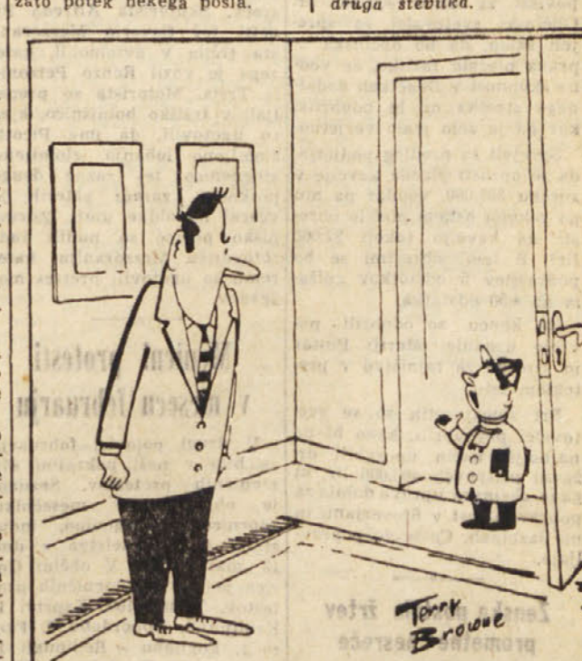
Ker b' ti bilo morda nerodno, da imaš takega šefa, sem učitelju rekla, da sem »N N«.

OVEN (od 21. 3. do 20. 4.) Vaši poslovni odnosi vam bodo preskrbeli nove rešitve vaših problemov. Slabo zdravje. BIK (od 21. 4. do 20. 5.) Dokončali boste neko delo, s katerim se je dolgo časa ukvarjate. DVOJČKA (od 21. 5. do 22. 6.) Preživeli boste dan v družbi svojih najljubših prijateljev. Zdravje popolno. RAK (od 23. 6. do 22. 7.) Ne trošite preveč denarja, kajti nepotrebni stroški bi zelo škodili vašemu gospodinjstvu. LEV (od 23. 7. do 22. 8.) Ne vztrajajte na svojih trditvah v okolju, ki jih ne bi razumelo. Zdravje dobro. DEVICA (od 23. 8. do 22. 9.) Nezaželen obisk vam bo pokvaril vse načrte. Zdravje izvrstno. TEHTNICA (od 23. 9. do 23. 10.) Večer preživite s svojimi prijatelji. Preživeli boste čas popolnega duševnega miru. SKORPIJON (od 24. 10. do 22. 11.) Ugotovili boste, da nekoliko diplomacije več velja kakor zaletlost in neposlušljivost. STRELEC (od 23. 11. do 20. 12.) Cuvajte družinsko harmonijo in bodite nekoliko postojljivi. ŠIBKO (od 21. 12. do 20. 1.) Dan je ugoden za razna manjša opravila, ki ste jih prejšnji teden zamemarili. VODNAR (od 21. 1. do 19. 2.) Obrekovanje ljubosumne osebe naj vas ne spravi iz ravnotežja. Precej dobro zdravje. RIBI (od 20. 2. do 20. 3.) Ne bodite prehitro prepričani o svoji zmagi ter nadzorujte zato potek nekoga posla.