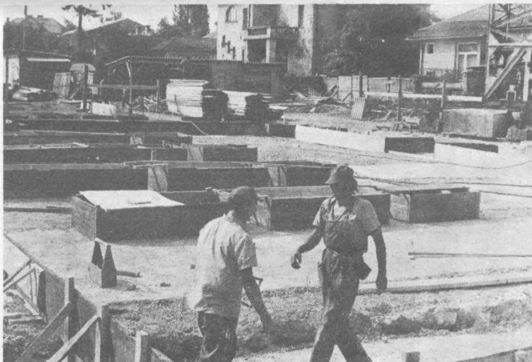
Gradnja doma za ostarele občane v Koleziji se je pričela

Zanimivo pa bi bilo ob tem slišati tudi to, kako se pobude družbenega pravobranilca samoupravljanja uveljavljajo v vrstih družbenopolitičnih skupnosti in v organizacijah združenega dela. Ob tem pa velja podčrtati tudi tisto usmeritev, ki še posebej podčrtuje vsestranskost razprav ob akcijah zaključnih računov. Vsekakor to poročilo, ki so ga delegati sprejeli, obvezuje vse samoupravne celice našega življenja, da še intenzivneje pristopijo k uresničevanju nalog.