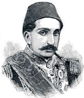
ABD UL HAMID turški sultan

Pesmi prednašajo na tamburici, ne na goslih kot srbski guslarji. Prvih sto verzov gre počasi, slovesno kot mohamedanski obredi, potem pa tako hitro, da se jim komaj sledi.