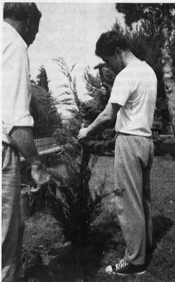
Tok časa in življenja - človeka in rastline. Očetovstvo, nasledstvo in novo drevo. Viri trajnega življenja

leto tako kot v sedanjem. Ostaja pa nerešen problem veroučiteljev-laikov. Ti nimajo še svojega staleža in zaradi tega pustijo verouk, če se jim ponudi priložnost stalne namestitve kot učitelja ali profesorja. In v tem