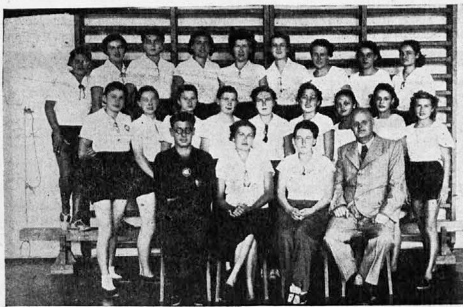
Župski prednjački tečaj za članice u Belom Manastiru od 21 do 30-VIII-1938