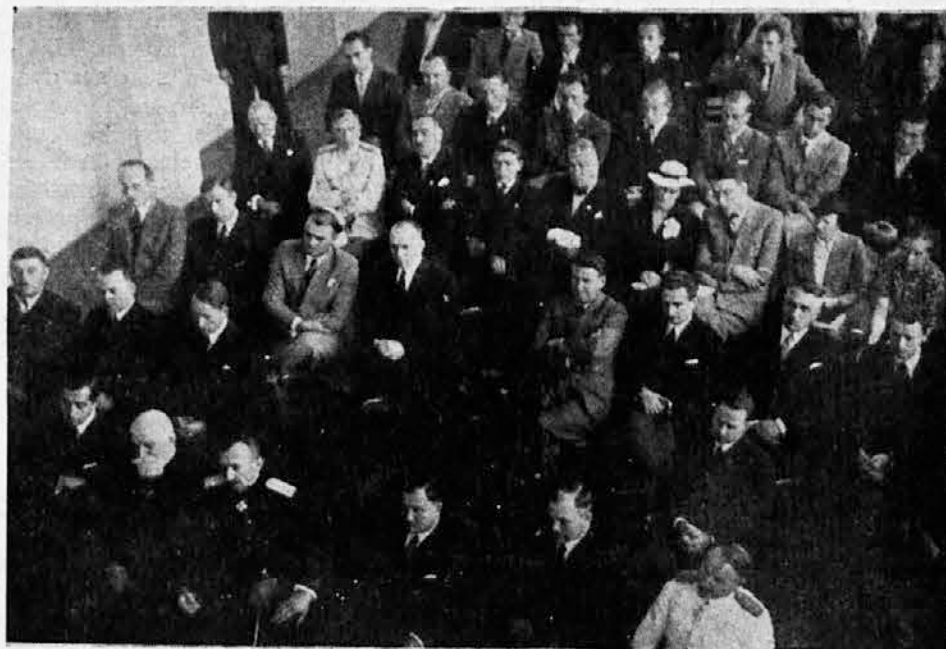
Otvaranje škole za telesno vaspitanje

vezno fizičko vaspitanje opštine grada Beograda g. Drom Belićem, zamenikom nastavnica tečaja — ušao je u pratnji gostiju i nastavnika u dvoranu gde su