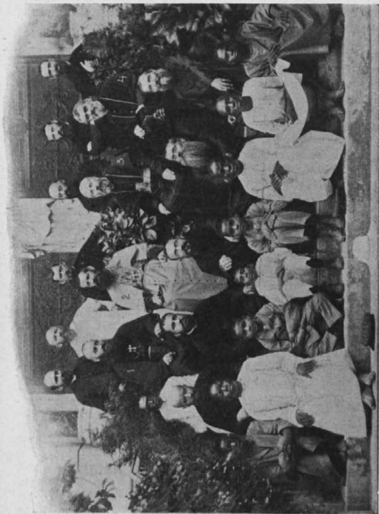
Skupina misijonarjev pri škofovskem posvečenju msgr. Munschla: 1 Škof Vogt. 2 Škof Munsch. 3 Škof Hanton. 4 Škof Allgeyer.