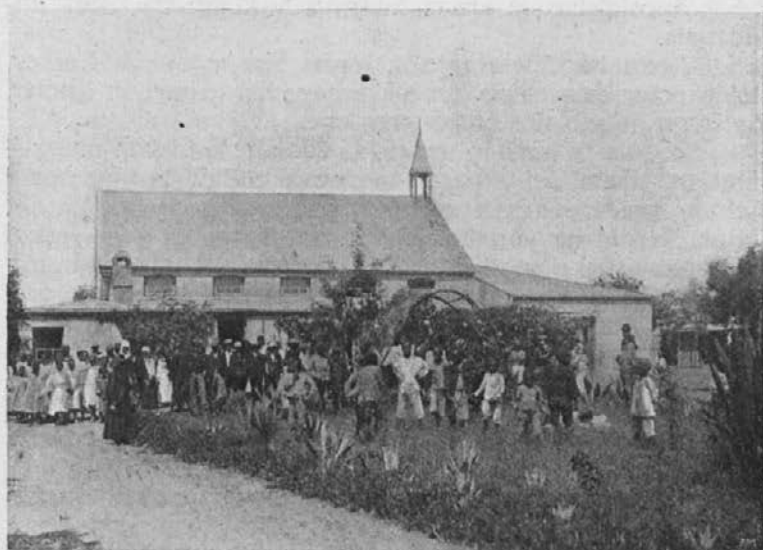
Otroci in odrasli Zulu-kristjani pred cerkvijo po končani službi božji.