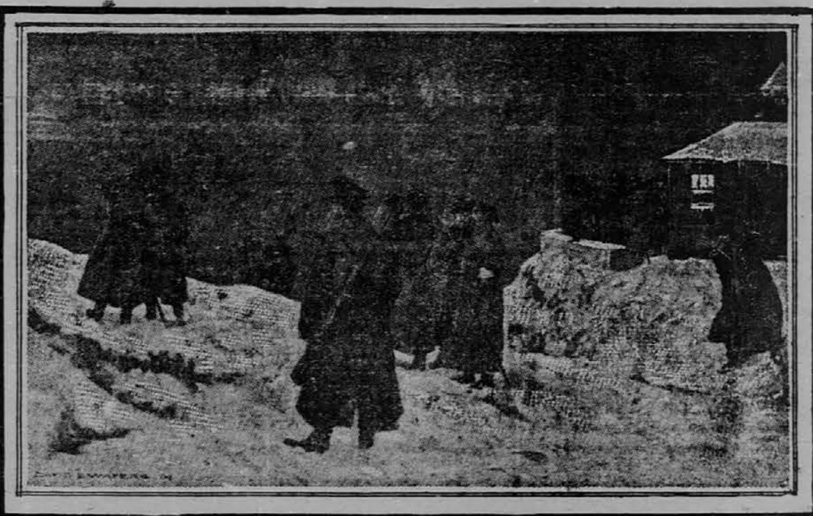
Signalna postaja v Port Arthuru.