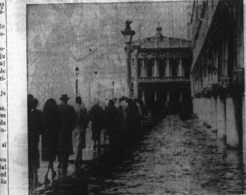
Vse je mogoče na svetu. — V Benetkah, ki so znane po svojih kanalih in vodnih ulicah je nedavno divjala povoden, ki je bila najhujša od leta 1836. Voda je prestopila bregove in poplavlila do 45 palcev visoko najbolj priljubljene promenadne ulice tega mesta. Po poplavljenih ulicah so bili postavljeni zasloni in vsi mostovi, da so jih lahko ljudje po svojih opravkih.

Maloprejšo blizu tam streljali na žensko, ki je hotela skrivaj prekoračiti razmejitveno črto y