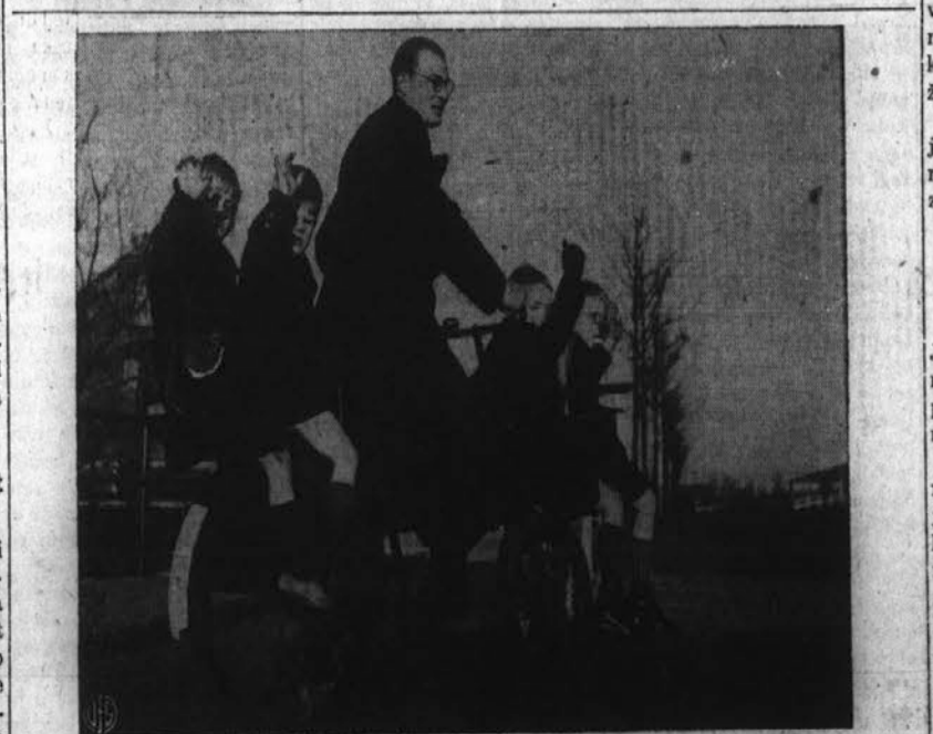
Bicikel za pet oseb. — Na sliki vidite bi cikel za pet oseb, kakršnega radi šolski sluga ljudske šole v Delft, Holandska, da z njim odpelje domov otroke, ki so slučajno zamudili v šolski bus.