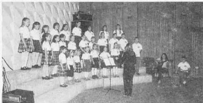
Otroški pevski zbor Zarja Mladosti

Argentinska stvarnost nas je, kot hud vihar, zavrtela v zraku in zopet surovo zagnala na tla. Stari in mladi iščejo novih poti. Prihodnost se nam prikazuje kot siv oblak, negotov, popolnoma brez oblike. V današnjem svetu, ko je kovanje denarja postala gonilna sila človeštva, nas se