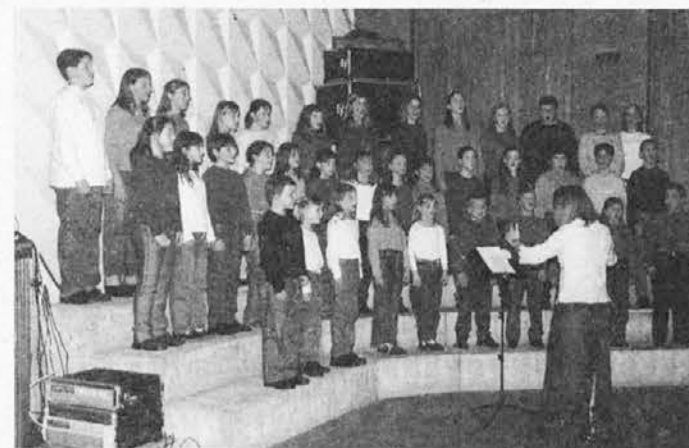
Otroški pevski zbor Zedinjena Slovenija

ključita ljubosumni duh, ko s silo odpelje Katerino iz odra.