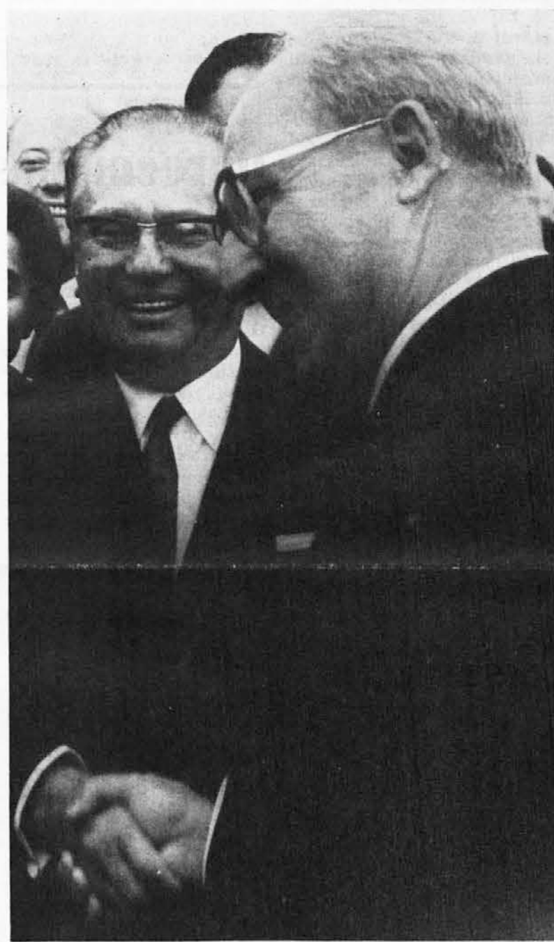
Predsednik SFR Jugoslavije Josip Broz-Tito in predsednik italijanske republike Giuseppe Saragat - Visoki jugoslovanski gost se je s soprogo Jovanko in spremstvom zadržal v Italiji pet dni. Zadnji dan je bil uradno sprejet tudi pri papežu Pavlu VI

Sloveniji in Hrvatski, utrjujejo mostove prijateljstva med dvema sosedoma. Cutimo prepričanje, in to prepričanje potrjuje praksa, da je skupno življenje narodnosti v razmerah, ko vladata svoboda in enakopravnost tvorni vzgib zblizevanja in sodelovanja. Zato cenimo vsak ukrep italijanske vlade in drugih odgovornih organov, ki je njegov cilj izboljšati položaj pripadnikov slovenske narodnosti v Italiji. Hkrati vam lahko zagotovim, gospod predsednik, da bomo tudi mi v Jugoslaviji, v prihodnje prav tako kot doslej, spoštovali načelo enakopravnosti in si prizadevali nadalje izboljšati položaj italijanske narodnosti v Jugoslaviji».