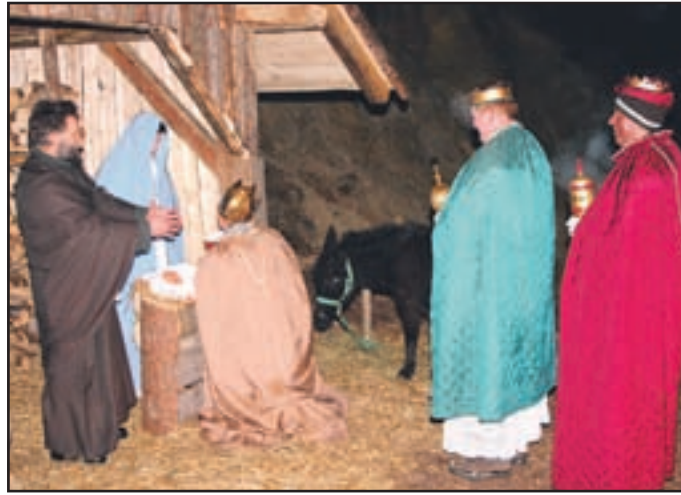
Prizori z lanskoletnih živih jasllic postajajo preteklost, saj Rečičani obljublajo vsebinsko in tekstovno prenovo.