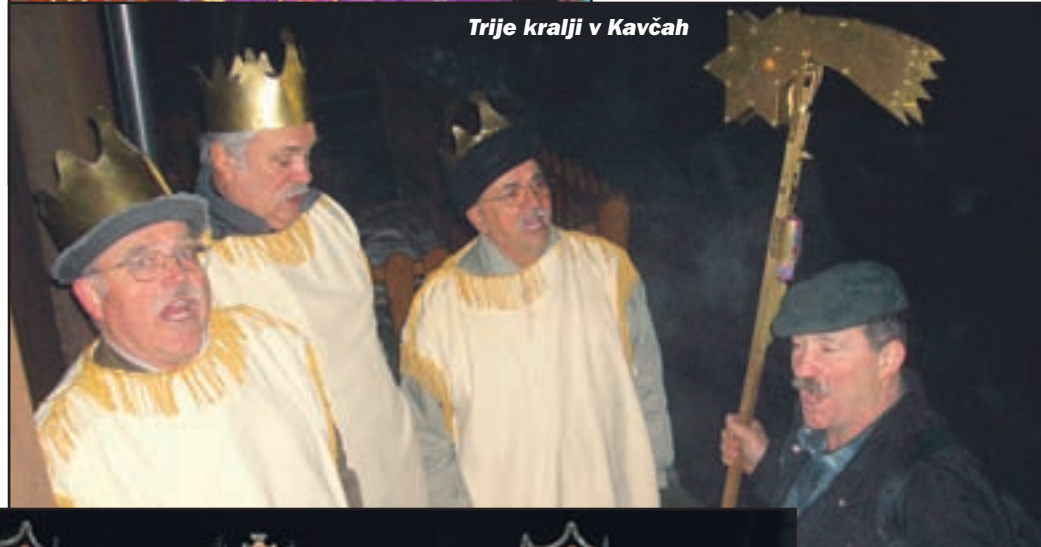
Trije kralji v Kavčah