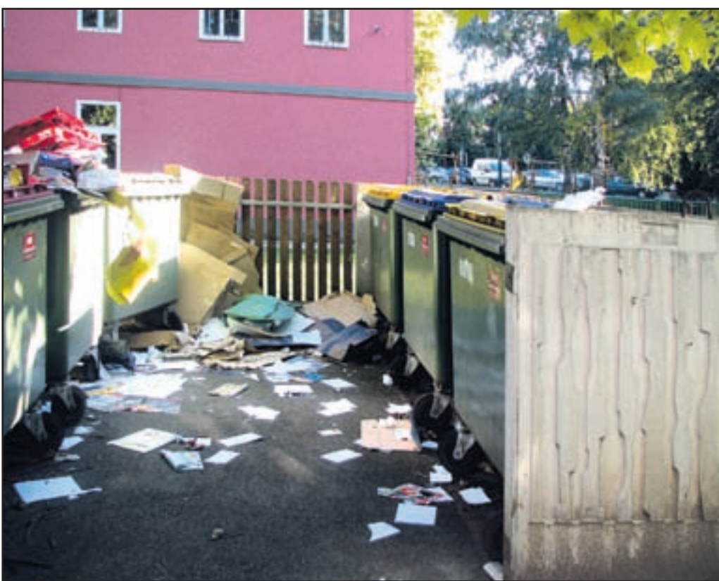
Ekološki otoki so vse prevečkrat polni smeti, ki tja ne sodijo. Tudi ločeno zbiranje odpadkov še ni povsod zaživel. Že kmalu pa bomo posebej zbirali tudi biološke odpadke.

»Za obstoječi standard imamo že iz leta 2005 sklep občinskega sveta za povišanje cene za 3,1 %, vendar doslej tega nismo uspeli realizirati. Upam, da bomo uspeli cene v letu 2008 povišati za 2 %. Kaj se bo zgodilo po tem, ko bomo začeli ločeno zbirati in odvažati biološke odpadke, pa še ne morem napovedati.«