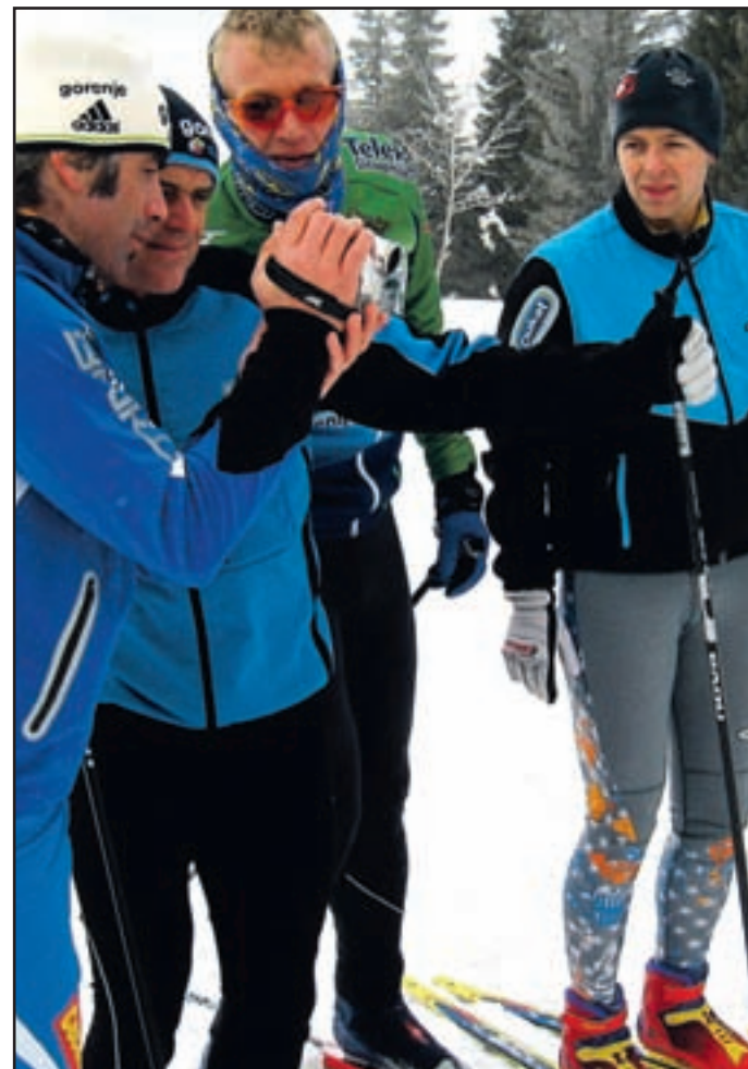
Tečajniki sproti spremljajo napredek lastnega teka.