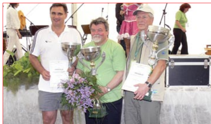
Razglasitev skupnih zmagovalcev.

Drugi dan druženja pa je bil namenjen delovnim in športnim tekmovanjem. Pri delu so se pomerili v varjenju, odvozu odpadkov, kanalizaciji, vodovodu in aranžiranju cvetja. V športnem delu so za tekmovalce pripravili zanimive športne igre, kot je hoja s hoduljami, nogomet, tenis, odbojka, tek, šah ... Ptujčani so se odlično izkazali. "Skupaj