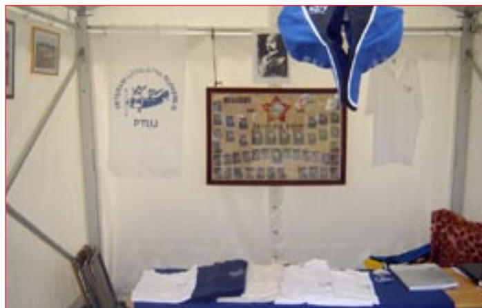
Razstavljeni spominki na stojnici.

Miting pa je bil med ostalim posvečen 80. obletnici LC Maribor, 30. obletnici Letališča Maribor, ki je bil preimenovan v Letališče Edvarda Rusjana Maribor, in pa seveda spominu na prvi polet Edvarda Rusjana, od katerega je minilo 99 let.