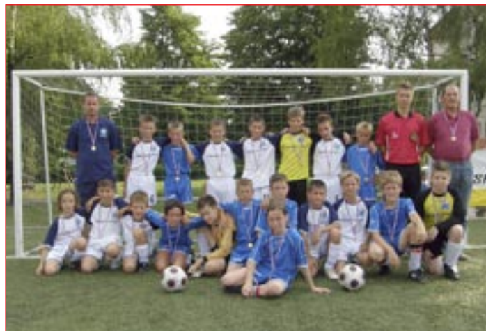
Skupinska fotografija finalistov lige MNZ Ptuj v kategoriji U-10 – modro-beli so naši »prvaki« .