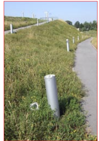
Polomjene luči na poti proti Puhovemu mostu.

Sodišče torej mladoletnim kršiteljem izreče vzgojni ukrep nadzorstva organa socialnega