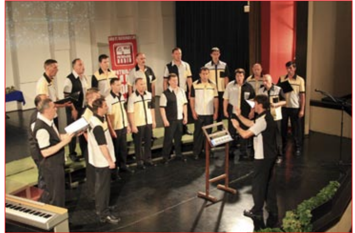
Komorni moški zbor iz Ptuja, med nastopom v Petrinji.

Z doseženim rezultatom so člani zbora vsekakor lahko zelo zadovoljni. Rezultat ima toliko večjo težo, ker je bil dosežen na tekmovanju, ki je namenjeno izključno komornim moškim zborom. Tako kot v Sloveniji tudi drugod po svetu število moških zborov zelo upada. Iz tega razloga se vse pogosteje dogaja, da moški zbori na tekmovanjih tekmujejo v istih kategorijah kot mešani zbori. Samo ugibamo lahko, kako lahko komisija primerja med seboj petje tako