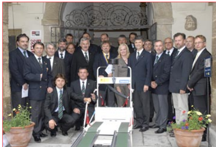
Ptujski Lionsi so predali v uporabo Pokrajinskemu muzeju Ptuj mobilni stopniščni vzpenjalec.

Trenutno je v Sloveniji 47 lions klubov, eden – ženski v Ljubljani je še v fazi ustanavljanja. Klubi so ženski, moški ali mešani. Slovenskih članov je skupno 1350. V svetu je registriranih 1.301.550 članov in 44.594 klubov. Sedež Mednarodne zveze Lions klubov (Lions clubs International) je v Oak Brooku, Illinois, ZDA. Organizacija obstaja od leta 1917. Za mesto nastanka organizacije velja Chicago, za ustanovitelja pa zavarovalničar Melvin Jones. Humanitarna organizacija je praznovala v letu 2007 v Chicagu svojih 90 let obstoja. Prvi klub v Evropi je bil ustanovljen na Švedskem, v Stocholmu, marca 1948. Tako letos lionizem v Evropi praznuje 60 let. V Sloveniji je bil ustanovljen prvi klub v Ljubljani, leta 1990, istega leta je bil ustanovljen še klub v Murski Soboti.