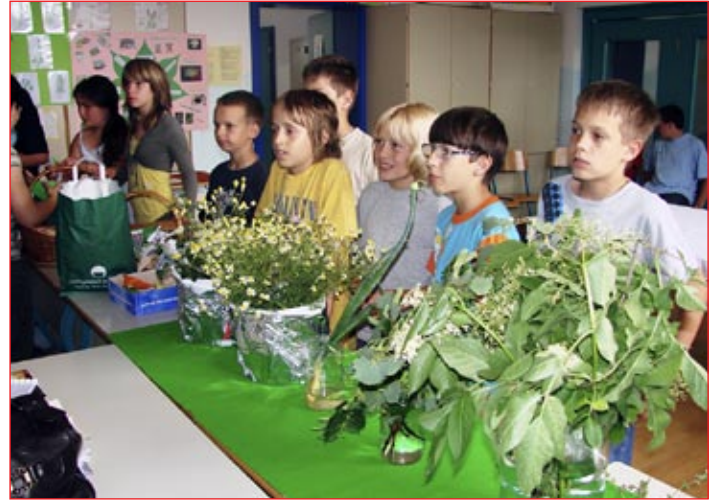
Petošolci pripravljajo razstavo zelišč.

Aktivnosti matične in podružnične šole se vseskozi prepletajo. Skupaj pripravljamo letni ekonačrt in imamo enoten ekoprogramski svet, ki se sestaja dvakrat letno. Obe šoli se skupaj predstavljata na ekostojnici na Ptujju ob dnevu Zemlje. V letošnjem letu smo sodelovanje poglobili še s skupno predstavitvijo našega dela na sejmu Altermed , ki je potekal 31. maja in 1. junija v Celju. Skupna tema predstavitve je bila Zdravo življenje , s