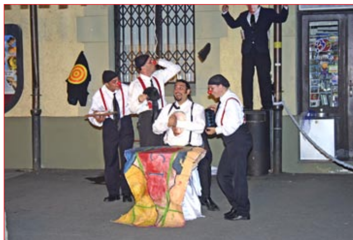
Predstava iz prejšnjih let