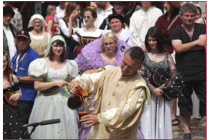
Na letošnji Prangerijadi se je zbrala množica kostumiranih članov turističnih in kulturnih društev iz cele Slovenije.