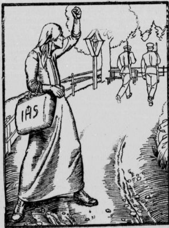
»Vižjo, kuščar neumni, zelenik«

Dežela brez ječe. To je Islandija, otok visoko gori v Atlantskem oceanu. Imeli so ječe, pa ni bilo leta in leta nobenega takega slučaja, in so sedaj vse ječe zaprli. Tudi policistov nimajo; tatov ne poznajo in beračev tudi ne. Ljudi je okoli