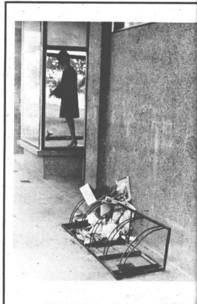
● Tihožitje na Rudarski cesti v Velenju

Čeprav z načrtovano proizvodnjo 3.900.000 ton lignita ob 42-urnem delavniku ne bo mogoče kriti niti vseh potreb termoelektrarn in industrije, za široko potrošnjo pa bodo na voljo le minimalne količine lignita, velenjski rudarji za zdaj še ne vedo, ali jim bodo priznani dejanski višji stroški za proizvodnjo dodatnih 250.000 ton lignita, ki bi ga bili pripravljene nakopati ob prostih sobotah v letošnjem letu!