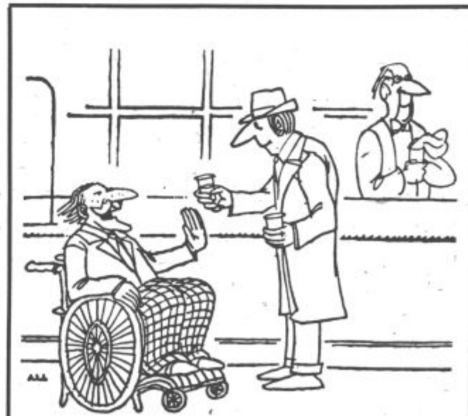
„Ne, hvala, nikoli ne pijem, če moram voziti ...“

Od 87 do 100 točk: Le s težavo boste kaj spremenili. Hodite po ustaljenih tirnicah, v sebi pa nosite svoj pesimizem. Če bi le malo bolj zaupali vase, bi bila tudi prihodnost veliko lepša.