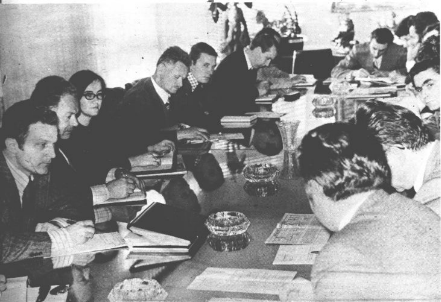
Z velenjskega pogovora o celodnevni šoli

Glavni in odgovorni urednik Ljuban Naraks