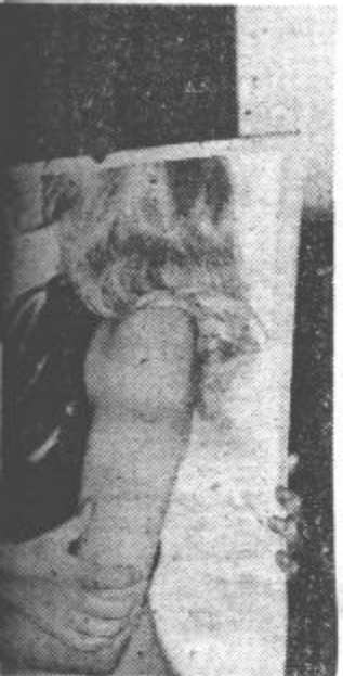
...nije za neko podjetje rekla- ... letošnje pomlad in poletje: ... hko izbirale plastične bluze