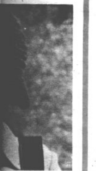
...dna kreatorka ... sa