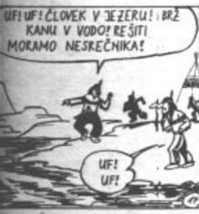
UFI! UFI! ČLOVEK V JEZERU! BRZ KANU V VODO! REŠITI MORAMO NESREČNIKA! UFI! UFI!