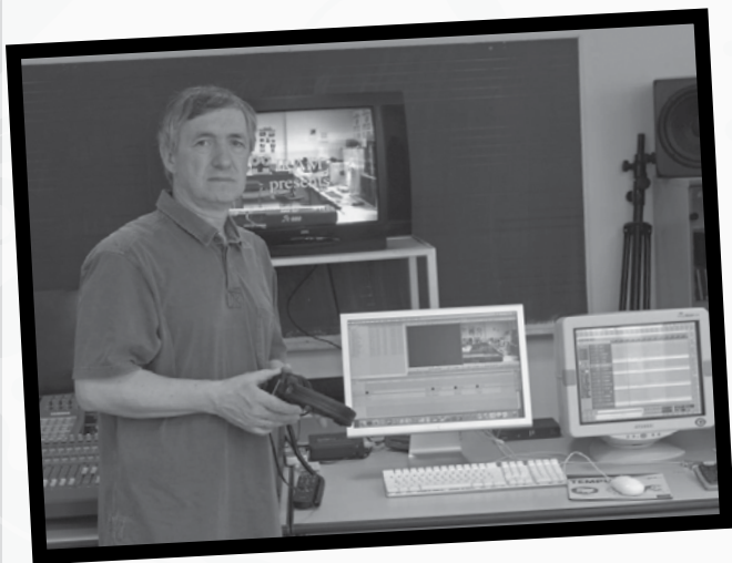
Bužarovski Dimitrije – od Raziskovalnih metodologij, aplikiranih v muzikologiji (2012) do Zgodovine glasbene estetike (2013)