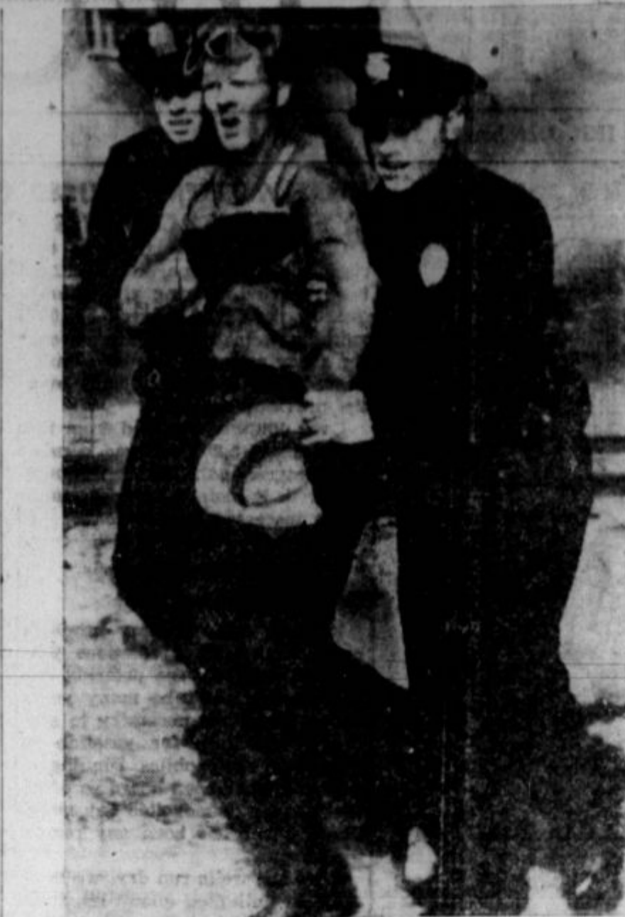
PRIZOR IZ STAVKE v filmski industriji v Californiji. Bila je v glavnem spor med dvema unijama AFL zaradi jurisdikcijskega vprašanja. Za delavstvo niso taki boji nič dobrega. Posebno ne v tem slučaju.

Vse to vpitje, kako smo za svobodno trgovino, za prost promet ter za demokracijo je le prevara. Kajti ne naša vlada, ne angleška, ne nobena druga se ne bi hotela nikdar brigati za kraje, v katerih bi ne bilo nič drugega kot le zanimanje za demokracijo, za civilne svobodščine, verstvo in take stvari. Gre se za profite, trgovino ter izkoriščanje prirodnih zakladov. Vse drugo je postransko.