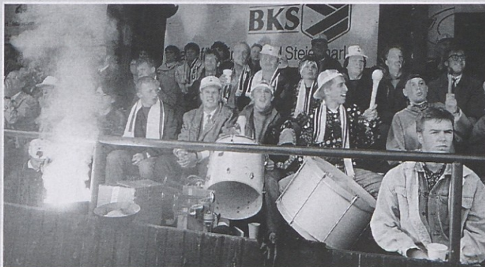
Se bo v Trnji vasi prebudil tudi SAK-jev „Fan-club“, ki je bil pred leti še najučinkovitejši na Koroškem?