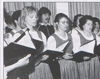
Nastopil je v Šentjuriju pri Grosupljem - MePZ J. P. Gallus.