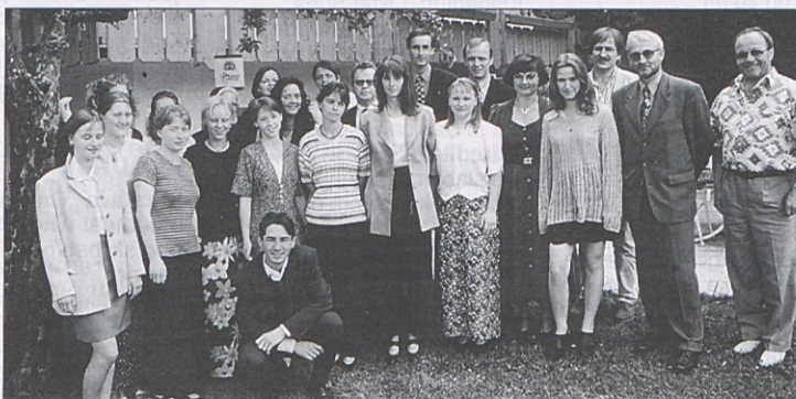
Letošnje maturantke in maturant ob sprejemu obeh osrednjih političnih organizacij (NSKS, ZSO) in Slovenske gospodarske zveze.