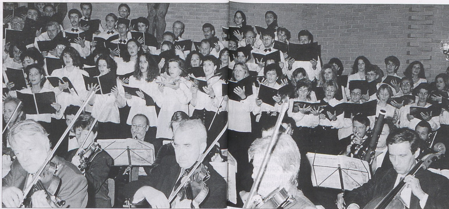
Schubertova maša je glasbeni projekt koroških Slovencev, ki za zmogljivost in kakovost naših zborov in zborovodij.