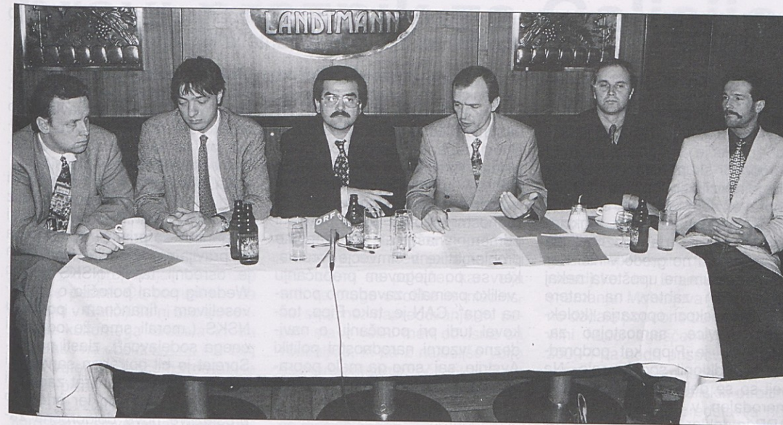
Zastopniki EL, NSKS in CAN so usmerjali razpravo v dunajskem parlamentu.