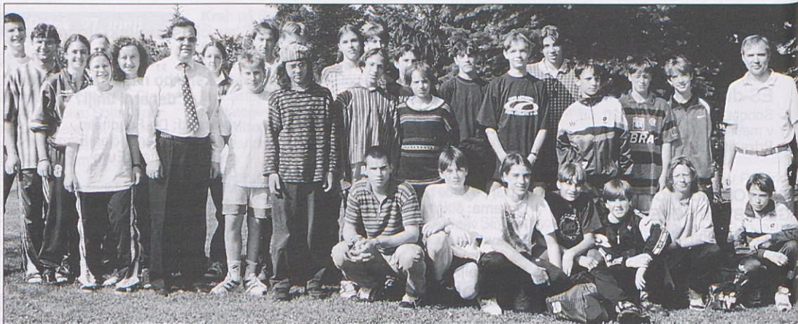
Delegacija mladih športnikov in odgovornih SŠZ na 21. srečanju slovenskih športnikov v Brežicah.