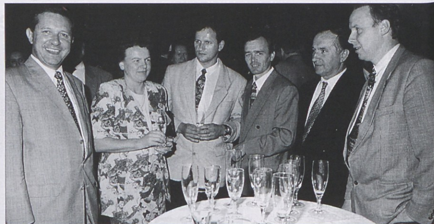
Sprejema na slovenskem konzulatu v Celovcu so se udeležili tudi predstavniki slovenskih političnih in kulturnih organizacij ter zastopniki občinskih frakcij.