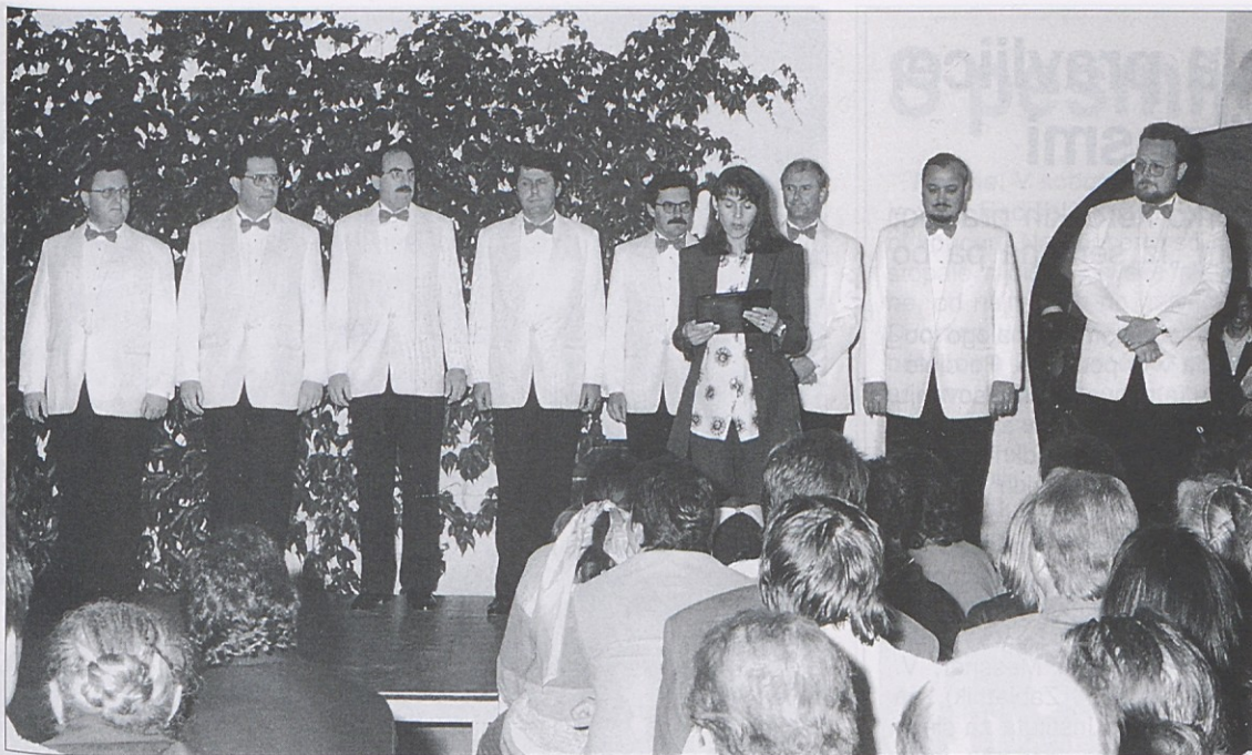
Iz Slovenije je prišel na Suho na serlanje oktetov Ljubljanski oktet in predstavil zelo kakovosten program.