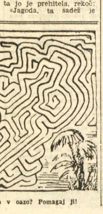
Kako bo kamela prišla v oazo? Pomagaj ji!

Naslednje jutro je deklica odšla spet v laze, a z seboj je nesla kanglico: ko se je vrnila, je bila ta prepelna drobnih rdečih sadežev. Darovala jih je bolni deklici, darovala jih je revnemu starčku. Pa še in še jih je nabrala ter darovala tudi drugim. Vsi so se čudili, kje da rastejo, ko pa oni sami niso prav nič vedeli zanje. Tudi otroci brezčrnežev so prosili Jagoda, naj jim da okusiti male, rdeče sadeže. Deklica jih je peljala kar v laze ter jim pokazala kraj, kjer si jih lahko naberejo. Ti, vsi srečni, so se jih nazobali ter jih nesli še starsem