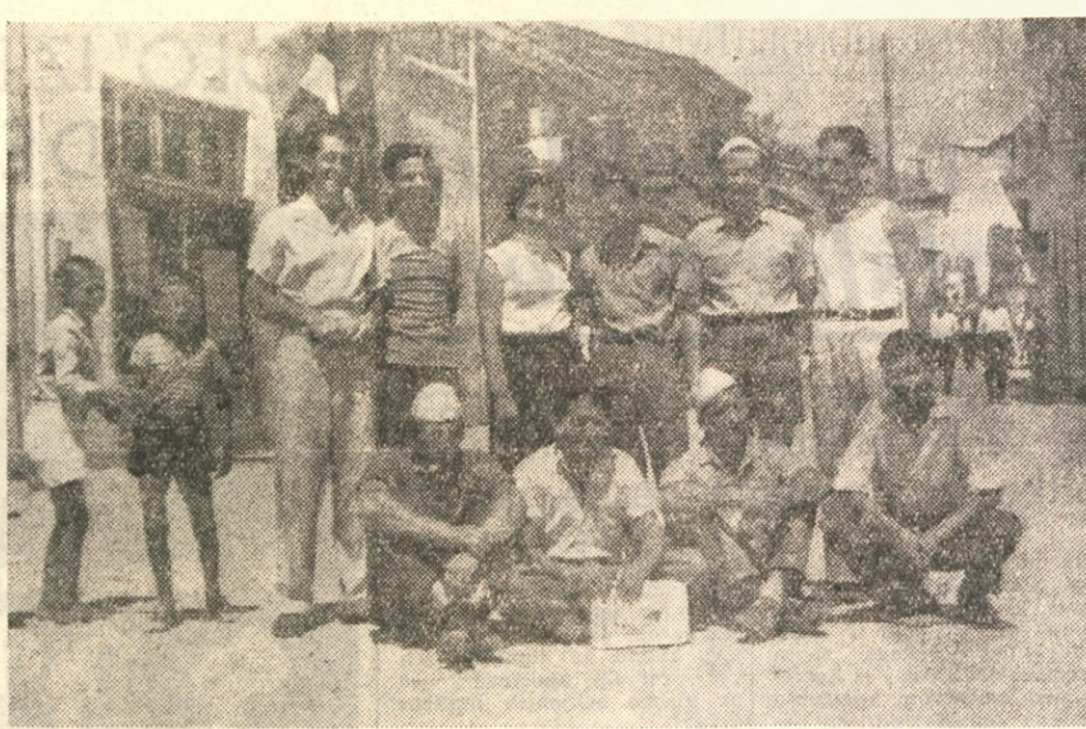
«Proletarci držijo skupaj in sede na tleh. Ohrid od obali»