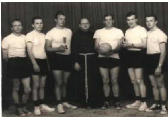
Odbojkarji in njihov glavni navijač.