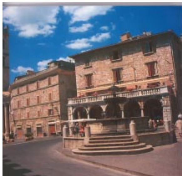
Središče mesta Assisi.