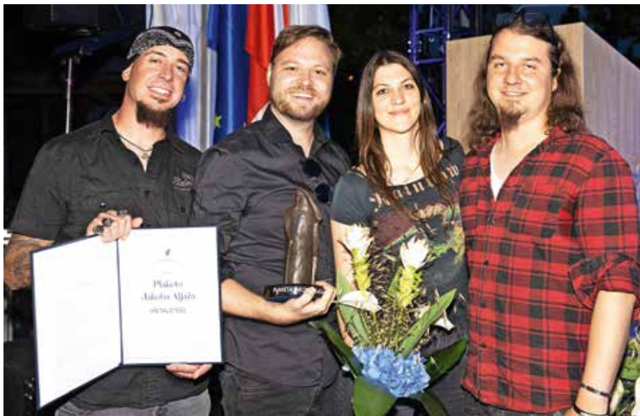
Skupina Metalsteel

ne po vseh uglednih glasbenih portalih in časopisih, njihova skladba Spomin je bila med drugim popevka tedna na Valu 202, njihov videospot za skladbo The End of the World se redno predvaja na RTV in velja za enega kakovostnejših slovenskih videospotov, ki je kot tudi