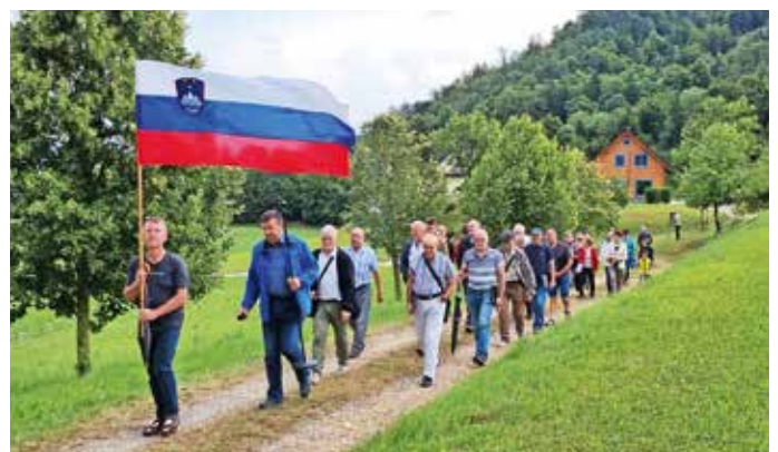
Pohod po Aleji Slovenija v počastitev dneva državnosti