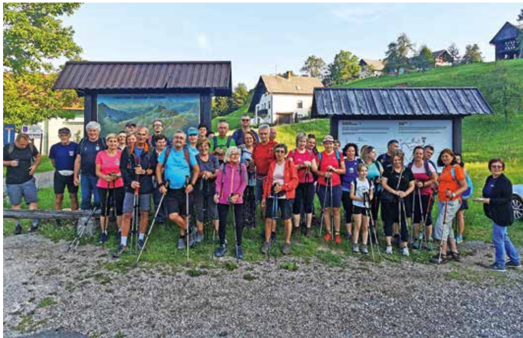
Lepo število pohodnikov se je na pot do rojstne hiše Jakoba Aljaža podalo s Topola.

Dogodek je potekal v organizaciji Javnega zavoda Sotočje. Z izvedbo in obiskom so zadovoljni. »Udeležba je bila dobra. S Topola in Hraše je startalo okrog petdeset pohodnikov, okrog deset se jih je priključilo še na Petelincu in v Žlebeh. To pomeni, da je bilo okrog 110 pohodnikov, kar je lepa številka. Vreme je bilo čudovito, proti koncu že skoraj prevroče. Tempo je bil takšen kot vsako leto, rav-