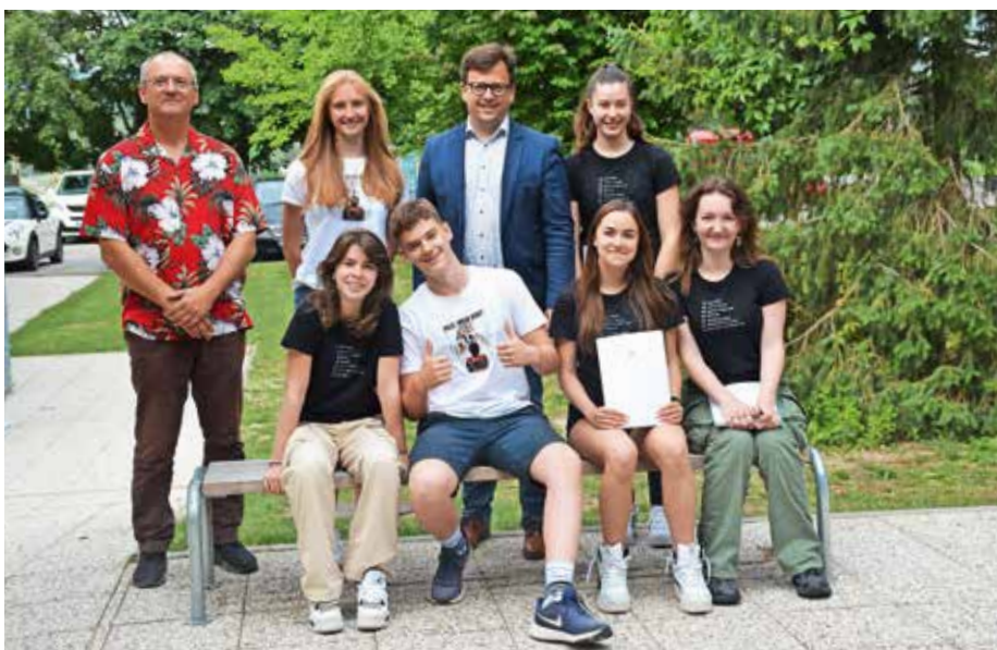
... in OŠ Simona Jenka Smlednik

kar učiti, a če se potrudiš, imaš motivacijo, se da,« je dejal. Pohvale si zasluži tudi za medvrstniško pomoč. »Imam sošolca, ki sem mu tudi jaz pomagal pri učenju in je zelo izboljšal ocene. Ponošen sem tudi na druge. Smo zelo odprt razred, si pomagamo. Posojamo si tudi zapiske. Zdi se mi, da je na naši šoli to kar praksa.« Odhaja na Gimnazijo Šentvid. Zanima ga naravoslovje.