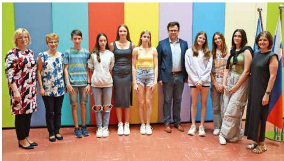
OŠ Pirniče