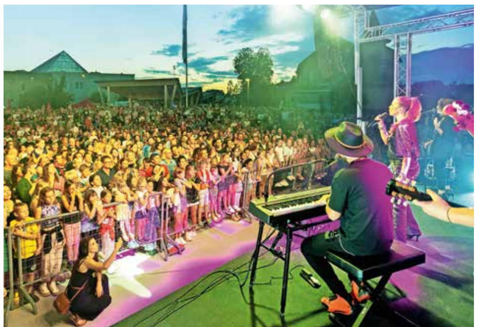
Nina Pušlar je napolnila središče Medvod.

Slovesno odprtje brvi je 8. julija v Medvodah dopolnilo še celodnevno dogajanje, ki se je zaključilo z brezplačnim koncertom Nine Pušlar. Potekala je Karavana okusov, kolesarji so se podali na celotno traso kolesarske poti Od brvi do brvi (na Senici, v Vikrčah in novo v Medvodah), ki je primerna za družine in rekreativne kolesarje. Odzivi so odlični. Nova pridobitev je vsč občanom Medvod, privablja pa tudi kolesarje od drugje.