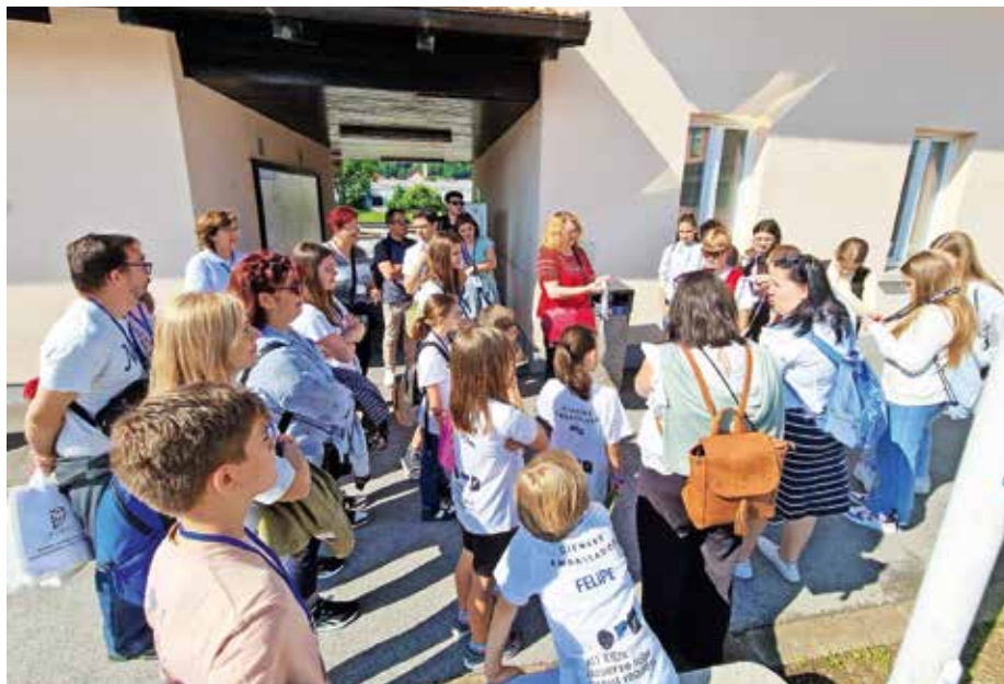
Gostje iz Španije so se družili tudi z učenci Osnovne šole Preska, ki so jih pričakali na železniški postaji v Medvodah.

Vsebinsko knjig so španski otroci povezovali tudi s Slovenijo, pri delu pa jih je usmerjala vodja delavnic Jacqueline