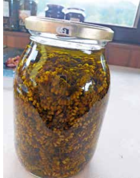
Trenutno je v polnem cvetenju šentjanževka, iz katere lahko pripravimo macerat.