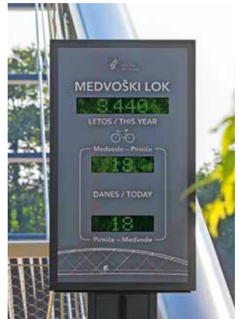
Kolesarski števec pri novi brvi