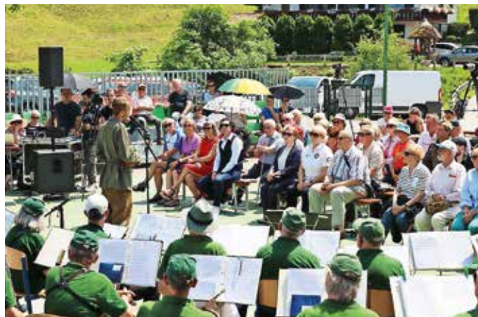
Utrinek s slovesnosti ob obletnici Dolomitske republike / Foto: Iztok Pipan

ker se danes stvari, ki so se dogajale nam, sedaj pač dogajajo drugim, se nam bo zgodovina vrnila. Razmišljanje, da se take stvari dogajajo drugim, nam pa se ne morejo več zgoditi, je zelo kratkovidno. Zato ne pozabimo: vsaka nova vojna se začne, ko prva naslednja generacija izgubi zgodovinski spomin,« je poudaril.