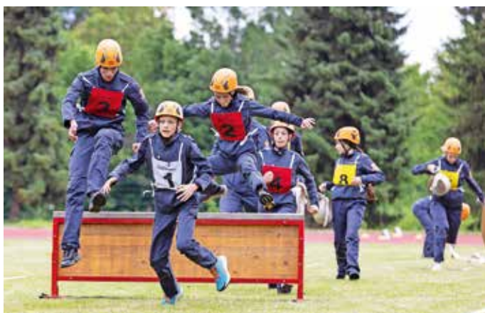
Mladinci so tekmovali v vaji z ovirami.

Gasilska zveza Medvode je 10. junija na atletski stezi Policijske akademije v Tacnu pripravila mladinsko tekmovanje v gasilskih športnih disciplinah. Več kot 160 tekmovalcev in tekmovalk se je pomerilo v štirih kategorijah. Gasilski pionirji in pionirke so tekmovali v vaji z vedrovko, štafeti na 400 metrov z ovirami in vaji razvrščanja, mladinci in mladinke pa v vaji z ovirami za mladince, štafeti na 400 metrov z ovirami in vaji razvrščanja. Sodniki so ocenjevali spretnost in natančnost pri izvajanju gasilskih veščin, hitrost ter sodelovanje ekip. Tekmovanja v Tacnu so se udeležile ekipe iz vseh medvoških gasilskih društev, manjkali so le mladi iz PGD Preska - Medvode. Tradicionalno so na tekmovanjih mladih gasilcev najboljše člani PGD Zbilje in letos je bilo podobno. Zmagali so v kategorijah pionirjev, pionirk in mladink, v kategoriji mladincev pa so jih premagali mladi iz PGD Smlednik. P. K.