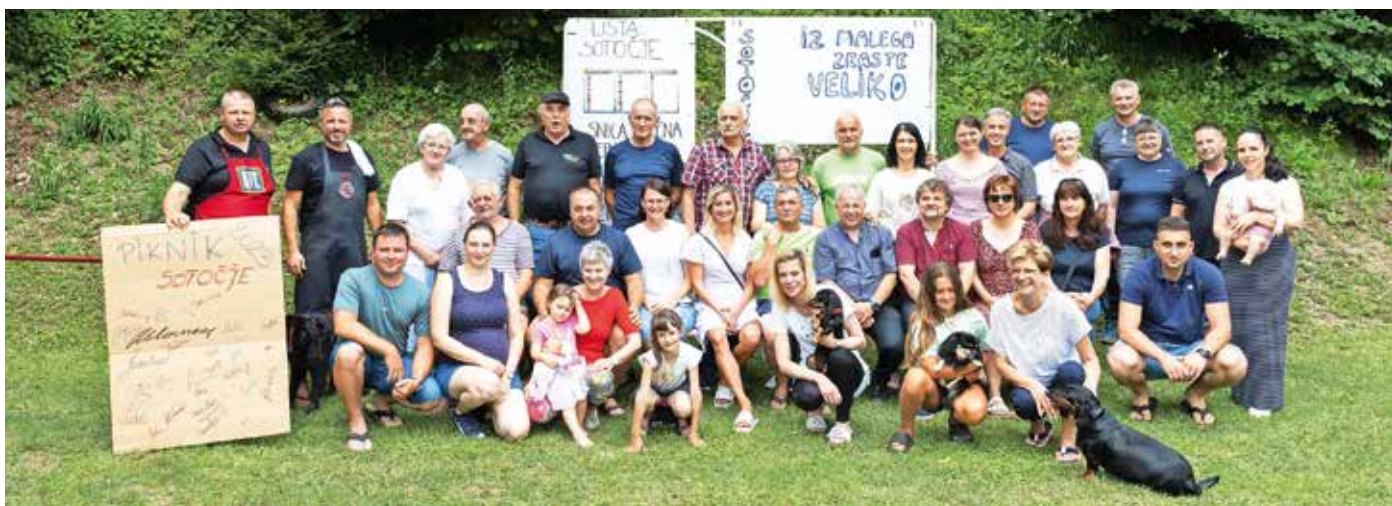
Kot vsako leto je Nestrankarska lista Sotočje na Zgornji Senici pripravila piknik, na katerega so povabili celoten občinski svet, prijatelje in podpornike. Vroče nedeljsko popoldne 2. julija je minilo v druženju brez bremena odločanja o pomembnih občinskih temah. P. K.