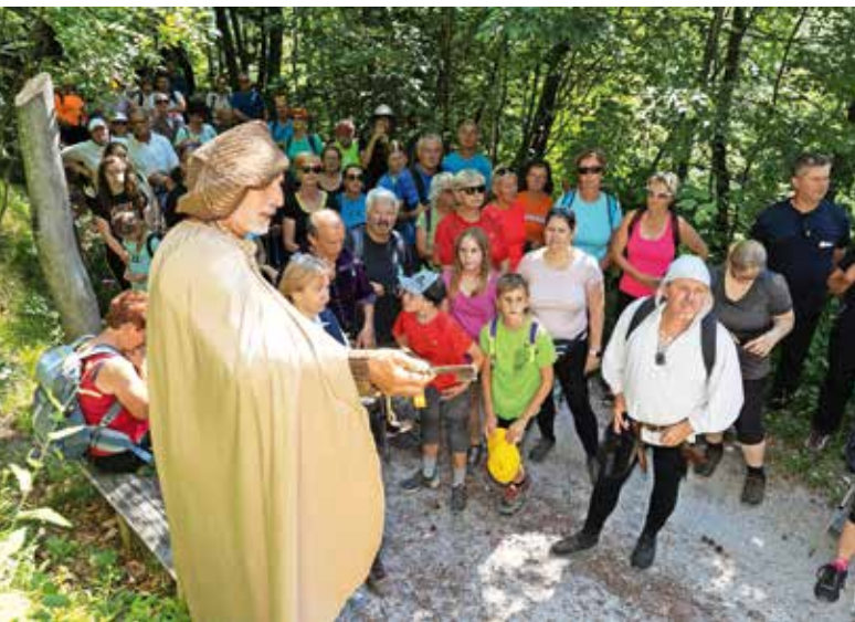
Na Gradišču so pohodniki spoznali lokacije in zanimivosti o izkopavanjih.