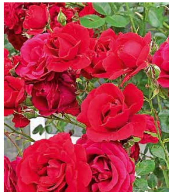
»Medvoška simpatija« je pretekli mesec navduševala s svojim cvetenjem.

Zlasti bi si želel, da bi s sodelavci lahko dobro vzdrževali to, kar smo v Arboretumu ustvarili. Imamo zelo lep rožni vrt, tudi oblikovno je na evropskem nivoju in v marsikaterem pogledu enkratno.