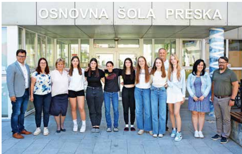
Najuspešnejši devetošolci OŠ Preska...