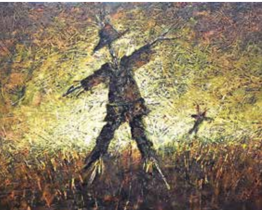
Avtor zmagovalne slike Ekstempora Hraše je Tone Gaber iz KUD Jarem.

Na prvi julijski ponedeljek so v Aljaževi rojstni hiši v Zavrhu na ogled postavili dela z ekstemporov Hraše in Aljaževina. Tema letošnjega ekstempora v Hrašah, ki je zaradi nestanovitnega vremena