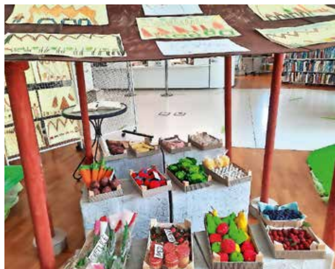
Utrinek z razstave Medvode – moj kraj / Foto: arhiv Knjižnice Medvode

Do 11. avgusta pa je v knjižnici na ogled že nova razstava, ki prikazuje ustvarjalnost otrok. Pripravila jo je Založba Malinc, njen naslov pa je Leo, leo v Sloveniji in Španiji. Razstavljeni so nekateri od izdelkov, ki so nastali v okviru projekta Pokrajine evropske književne raznolikosti. Ob izdelkih slovenskih otrok, ki so jih ustvarili ob besedilih iz španskega govornega območja, obiskovalci razstave lahko pokukajo tudi v ustvarjalne dosežke španskih otrok, ki so ustvarjali ob v španščino prevedenih besedilih slovenskih avtorjev.