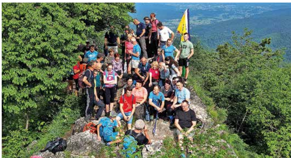
Planinci iz dveh sosednjih občin na Grmadi

PD Medvode in PD Blagajana sta 10. junija pozno popoldne pripravila sedaj že tradicionalno srečanje na vrhu Polhograjske Grmade ob obletnici postavitve orientacijske plošče. To je kažipot po sosednjih bližnjih in daljših vrhovih. Člani društev so prišli vsak s svoje strani. Tako je že vse od leta 2001, ko je bilo na tem razgledniku prvo uradno srečanje planincev občin Medvode in Polhov Gradec. Letos se jih je zbralo skoraj petdeset, med njimi župana obeh občin, ki sta zbrane tudi nagovorila. Srečanje so nato nadaljevali na kmetiji odprtih vrat na Gontah. M. B.