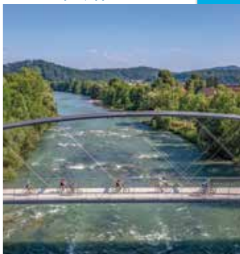
Nova kolesarska brv čez Savo v Medvodah