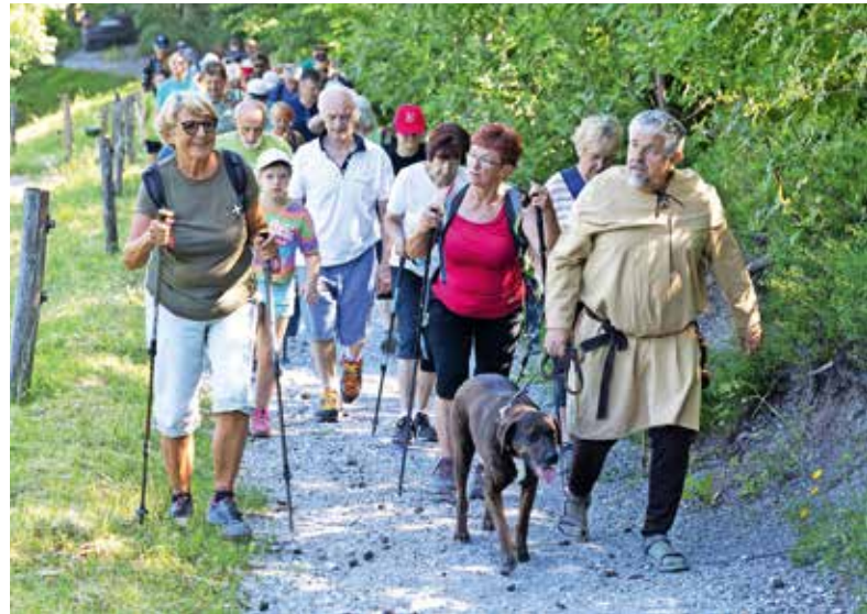
Pot je pohodnike z Marjete vodila proti Jeterbenku.

V dvajsetih letih se trasa pohoda ni spremenila. Prva skupina pohodnikov je pot začela pri Osnovni šoli Preska, dobre pol ure pozneje pa so se jim pri Galeriji pod kozolcem pod cerkvijo sv. Marjete v Žlebeh pridružili preostali. Od tam so skupaj odšli do cerkve, kjer so jih čakali njen ogled, okrepčilo in navodila za nadaljnjo pot. Odšli so do Gradišča in naprej okrog Jeterbenka do cerkve sv. Jakoba na Petelincu. Tam so letos okolico pripravili za prihajajočo obnovo cerkve. Pohodniki so si ogledali njeno notranjost in prisluhnili kratkemu nastopu Sorških orgličarjev. Sledil je hiter spust do Branovega in zaslužena malica ter druženje, ki so ga popestrili srednjeveški gostje. TD Žlebe - Marjeta je letos v svoje vrste povabilo viteze iz Žužemberka, ki so s seboj prinesli srednjeveške igre