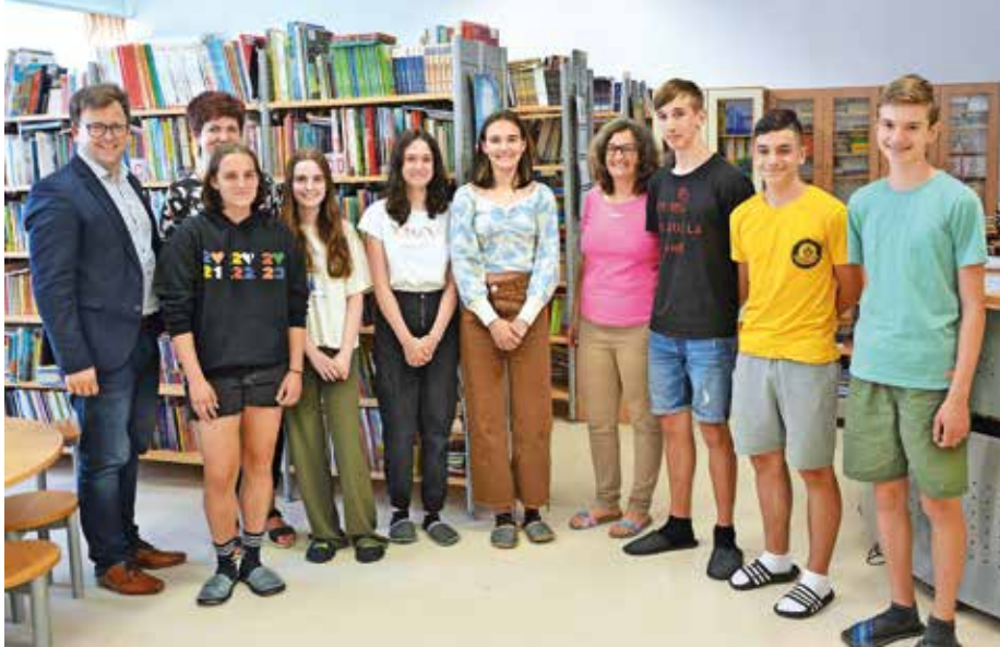
... OŠ Medvode