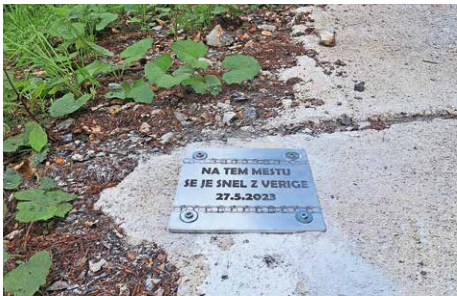
Ploščica označuje mesto, kjer se je Primožu Rogliču na poti k zmagi na kronometru iz Trbiža na Višarje in k skupni zmagi na Giru snela veriga.

S pritrditvijo se strinjajo tudi Italijani, saj bodo ploščico še dodatno označili, da bo bolj vidna.