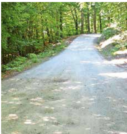
Asfaltirali bodo še dobrega pol kilometra ceste.

Gre za eno izmed prioritetenih investicij, ki jih je predlagala Krajevna skupnost Sora. »Na Občini Medvode si prizadevamo, da skladno s finančnimi zmožnostmi asfaltiramo čim več makadamskih cest na območju Polhograjcev, saj se s tem izboljša kvaliteta bivanja in hkrati znižajo stroški vzdrževanja cest. Na odseku Sora–Osolnik bo po zaključku del ostal le še en neasfaltiran odsek, ki ga bomo asfaltirali takoj, ko bodo zagoto-