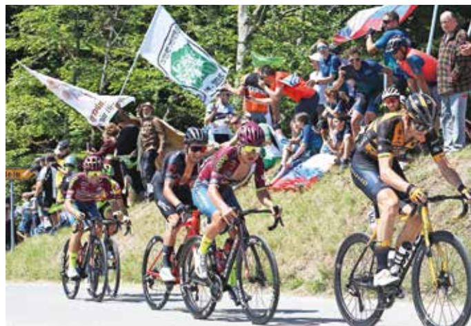
Kolesarje je na dirki Po Sloveniji predzadnja etapa vodila tudi skozi del občine Medvode, v katero so vstopili na Topolu, kjer so jih pozdravili številni navijači, tudi roparski vitezi. V Medvodah pa so imeli leteči cilj. M. B.