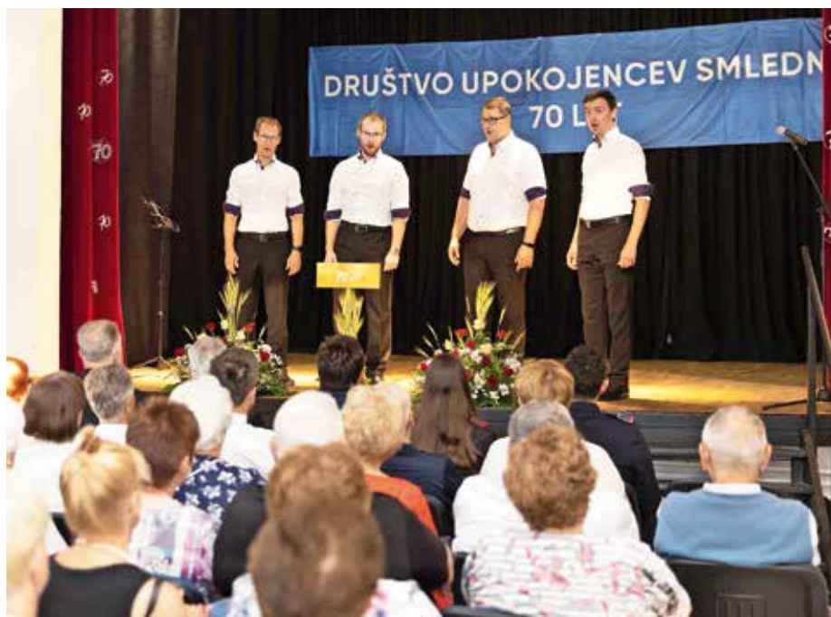
V kulturnem programu ob 70-letnici društva je teden dni po letnem koncertu nastopila tudi vokalna skupina Foné Megále.

Društvo si s svojo dejavnostjo prizadeva izboljšati gmotni položaj upokojencev, organizira in izvaja kulturne, rekreativne, zdravstvene in izobraževalne dejavnosti. Organizira srečanja, prireditve, izlete in seznanja upokojence s social-