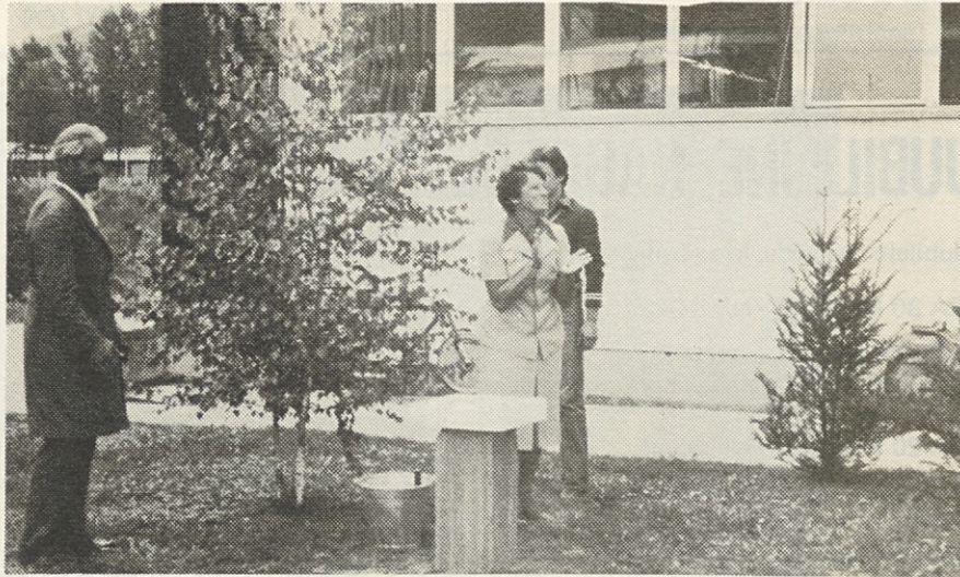
Fotografija št. 2 :

Nagradne križanke ni, zato smo se v uredništvu odločili, da bomo objavljali tu in tam kakšno fotografijo, kjer bomo preverjali znanje o kulturnih znamenitostnih in pomembnejših dogodkih in naši ožji domovini. Danes sta objavljeni dve fotografiji.