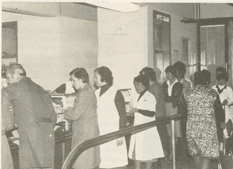
ŽENE, DEKLETA, MATERE — KAJ MISLITE ?

Praznujte lepo, toda ne zadovoljite se s šopkom, darilom, boriti se morate za lepši, enakopravnejši jutri.