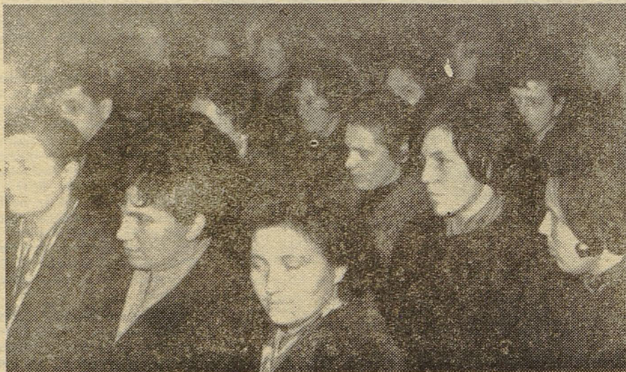
S sindikalne letne konference v tovarni elektromotorjev v železnikih