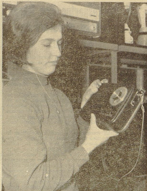
Novi radijski transistorski »Hockey 66« sezanske tovarne vzbuja zaradi svoje moderne in funkcionalne oblike veliko pozornost kupcev