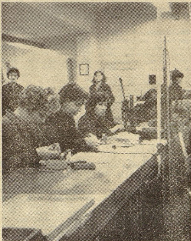
Iz montaže obrata v Lipnici