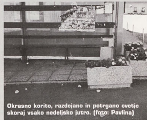
Okrasno korito, razdejano in potrgano cvetje skoraj vsako nedeljsko jutro.

Volilna kampanja se je pričela. Povsod nas plakati opozarjajo na bližajoče se volitve in na kandidate, med katerimi bomo izbirali.