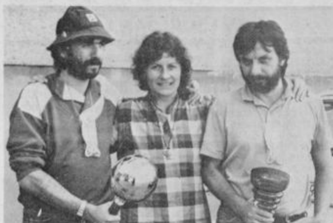
Zmagoslavni Ljubljančani s prehodnim in trajnim pokalom v rokah