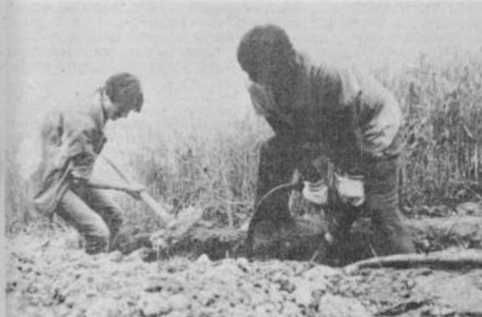
Utrinek z delovišča akcije v Destrniku

Poleg dela na trasi so zaživele tudi interesne dejavnosti; razni krožki in tečaji so dobro obiskani, zaživele pa so tudi športne aktivnosti. Bravo brigadirji, le tako naprej!