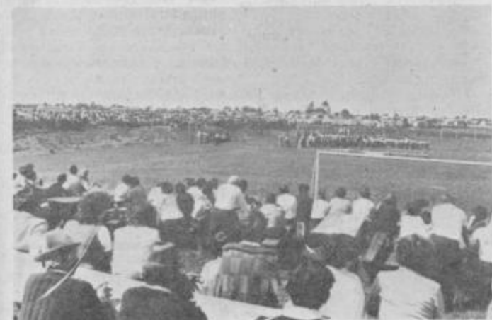
Prireditve je bila izredno obiskana

Kar 2000 ljudi se je v nedeljo zbralo ob novem igrišču v Bukovcih in si ogledalo velik telovadni nastop, ki so ga izvedli učenci OŠ Markovci ter člani in članice TVD Partizan Slovenj Gradec, Markovci in Ptuj, nastopila pa je tudi folklorna skupina Anton Strafela.