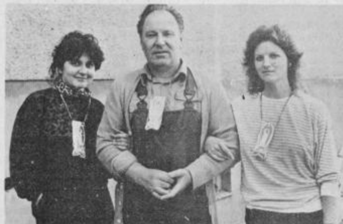
Ekipo I — Radia in Tednika je tokrat dosegla odlično drugo mesto.

Oblačno in deževno vreme ni zmotilo prijetnega vzdušja na tradicionalnem, tokrat že enajstem tekmovanju slovenskih novinarjev v športnem ribolovu, ki smo ga tudi tokrat pripravili člani ptujskega aktivnega Društva novinarjev Slovenije. Predstavniki slovenskih sredstev javnega obveščanja (seveda tudi predstavnice) smo se tokrat za spremembo zbrali v novi restavraciji Ribič, kjer so nas toplo sprejeli. Polni upov in ribiške domišljije smo se odpravili ob ribnik v Trzcu, kjer smo ogrinjani v pelerine bolj strahali kot privabljalci nestrpne zelenike in ostriže. Pri izvedbi samega ribiškega tekmovanja so se še posebej dobro izkazali člani sodniške komisije Ribiške družine Ptuj, ki praznuje prav te dni svojo 35-letnico uspešnega delovanja.