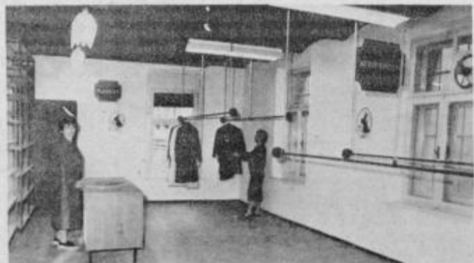
Posrednik je edina prodajalna, ki je bila ob otvoritvi takorekoč prazna. Police in obešalniki čakajo na blago, ki ga bodo prinesli občani.

Občani bodo morali za posredništvo odšteti 30-odstotkov vrednosti blaga, prodajna cena pa bo povečana še za 4,5 odstotka republiškega in občinskega prometnega davka. Prodajno vrednost bosta prodajalec in trgovec določila na podlagi sedanjih cen, seveda primerno uporabnosti ponujenega blaga. Prav gotovo pa bo imel pri določanju