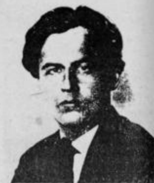
Narodni heroj doktor Mladen Stojanović