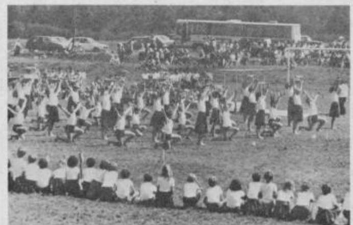
Nastop je obsegal ritmične in telovadne točke, primerne za različne starostne kategorije