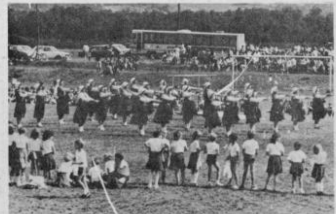
Posebno pozornost so pritegnile starejše članice TVD Partizan Markovci