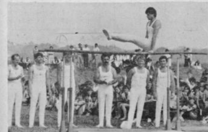
Člani TVD Partizan Slovenj Gradec (pobrateno je s TVD Partizan Markovci) so z nastopom na bradlji pokazali, da v nekaterih društvih še vedno posvečajo pozornost osnovni telesni vzgoji — gimnastiki