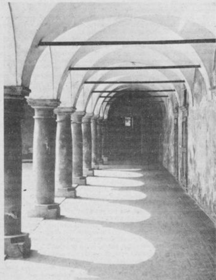
Pogled na del minoritskega samostana