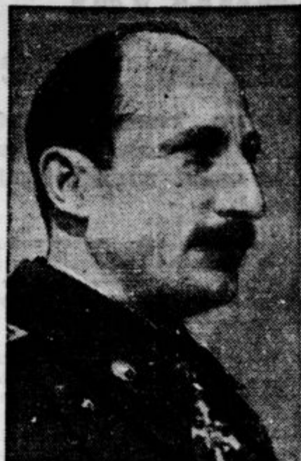
Ki je z razpletom zadnje vladne krize znatno ojačal svojo avtoriteto