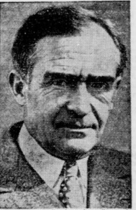
Vzporedno s pospešenim oboroževanjem evropskih držav se organizira tudi akcija Rdečega križa za obrambo v vojni. Belgija je dobila novega predsednika te ustanove v osebi admirala C. T. Graysona