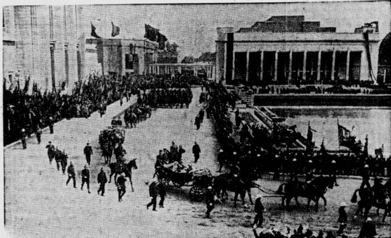
Mednarodno gospodarsko razstavo v Bruslju je otvoril belgijski kralj s kraljico in velikim spričestvom