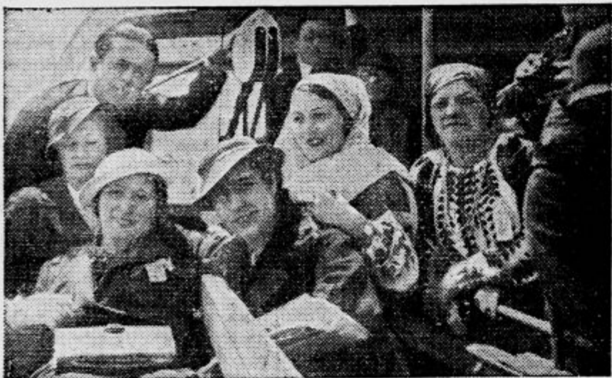
So bile predmet splošnega občudovanja na zborovanju Mednarodne ženske zveze v Carigradu. Rumunske delegatke so izvršile z njimi uspešno propagando za svojo državo