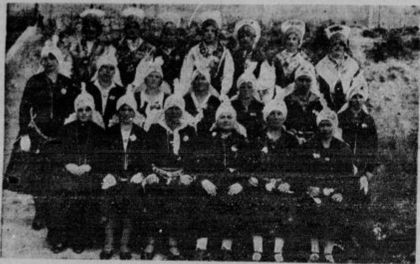
Neke ženske iz Sv. Jakoba ob Savi, ki so se udeležile euharističnega kongresa v Mostah.