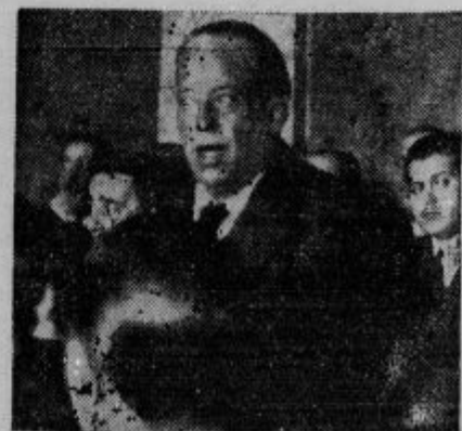
V Madridu se je začela pred državnim sodiščem obravnava proti monarhistom, ki so obdolženi, da so organizirali monarhistično vstajo z namenom, da bi strmoglavili republiko in poklicali španskega kralja Alfonza nazaj. Kakor kaže slika, se je gen. Sanjurjo branil pred sodiščem z vse vnanje