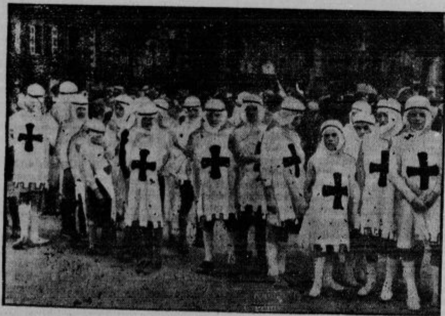
V starem francoskem mestu Angers priredijo vsako leto euharistični kongres, na katerega pridejo romarji vsega sveta. — Križarji in križarice med procesijo.