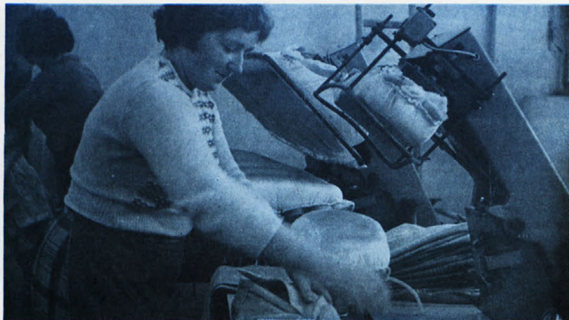
Ko se segreje, doseže temperatura v TOZD Temenica v „špicah“ tudi do 38°C, ve dar upajo, da bo to poletje zadnjič tako ...

Dvajset let kasneje, ob trideseti obletnici uvedbe delavskega samoupravljanja v naši družbi, ko smo priče in soustvarjalci prcj neslutnih ustvarjalnih pobud najširših ljudskih množic v Jugoslaviji, ve in vidi vse svet: pota za osvobajanje dela so pri nas odprta tako široko, kot niso bila nikoli doslej v zgodovini človeštva. Ne zavoljo drugih in ne zaradi propagandnih gesel,