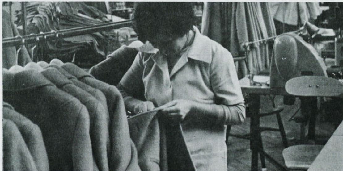
V Zali pravijo, da najraje delajo na težkih oblačilih kot so plašči in zimski kostimi.

Za to nas vse vabijo, da pridemo, si izmenjamo mnenja, stališča in tako skupno gradimo naše DO.