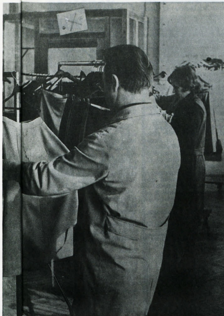
Kontrola končnega izdelka je natančna in stroga - posnetek iz TOZD TIP-TOP.

Tako smo se v Labodu odločili za podelitev priznanja ob Dnevu samoupravljalcev, 27. juniju. Včasih je morda težko med številnimi aktivnimi in zasluznimi najti najboljšega, vendar ob pogledu na delo nazaj, ob usmeritvah naprej, ob upoštevanju tovarštva in odnosov do sodelavcev in do dela, to tudi ni nemogoče. Kajti naša družba zahteva dobrega delavca in funkcionarja hkrati, eno brez drugega je pa premalo.