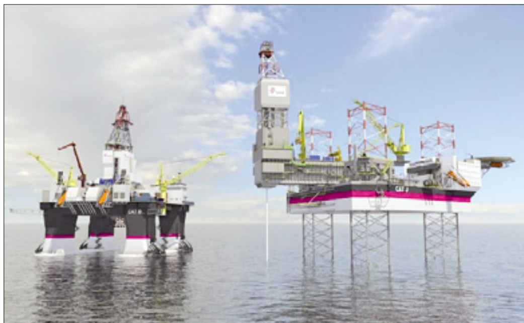
Tako naj bi izgledalo načrtovano naftno polje

OSLO - Norveški naftni velikan Statoil je včeraj predstavil načrt razvoja največjega naftnega polja po osemdesetih letih prejšnjega stoletja. Nahajališče Johan Sverdrup bi lahko koncernu prineslo okoli 1350 milijard kron (155,96 milijard evrov) prihodkov in ustvarilo 50.000 delovnih mest.