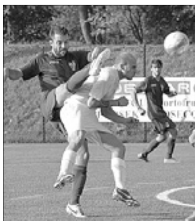
V prvem delu je zmagala Zarja 0:1