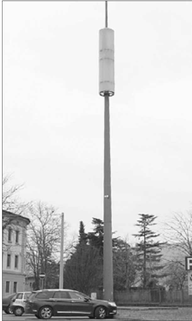
Antena družbe Wind v Ulici Catterini ob Kornu