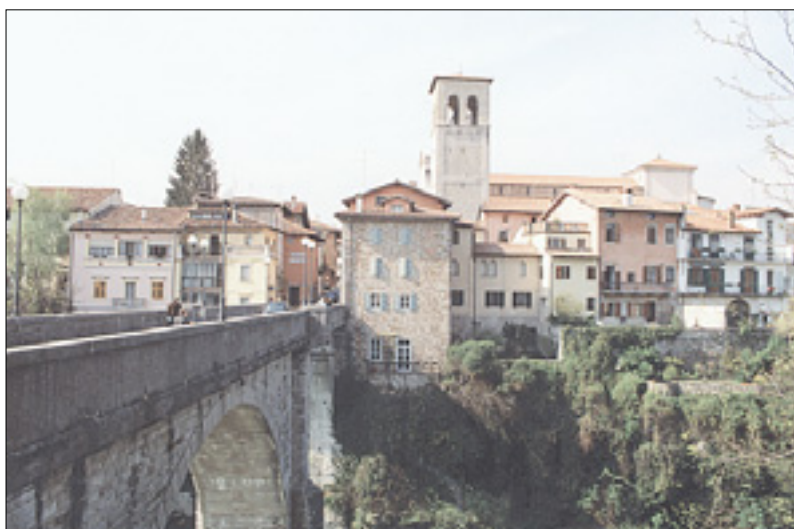
Pogled na Čedad s hudičevim mostom na levi

Dežela pa ni upoštevala istega kriterija za Nadiške in Terske doline. Beneške občine ob Nadiži so namreč vključene v unijo, ki šteje 52.112 prebivalcev. Slovenske gorate občine Dreka, Grmek, Srednje, Sovodnja,