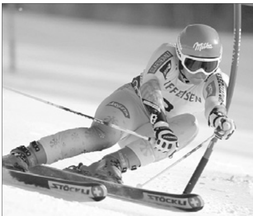
Slovenska smučarka Tina Maze vodi tudi v skupnem seštevku svetovnega pokala