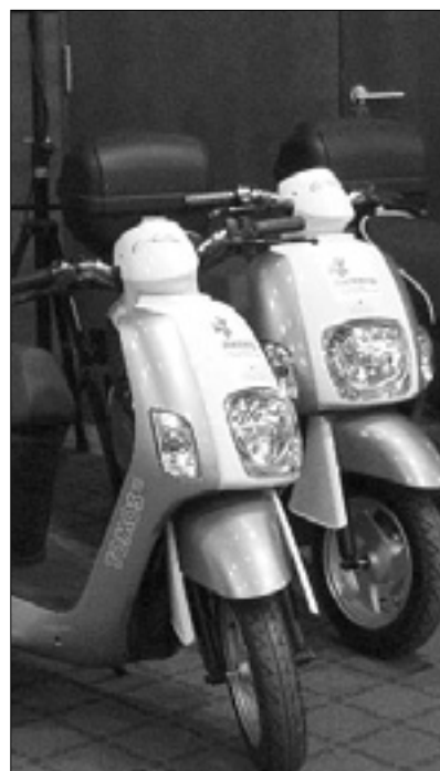
Električni skuterji za javne uslužbence

Med njimi so tudi Miren-Kostanjevica, Šempeter-Vrtojba in Brda