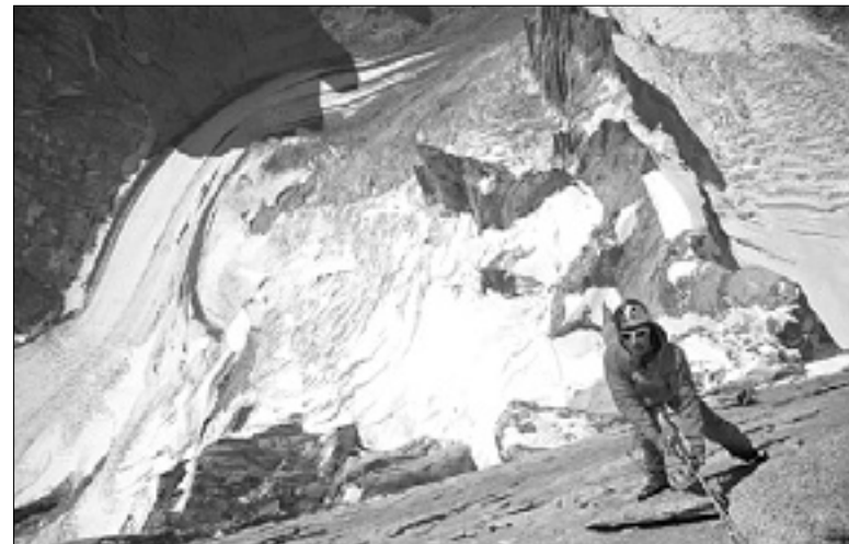
Prizor iz avstrijskega filma Cerro Torre - A snowball's chance in hell

Prihodnji četrtek se v gledališče Miela vrača festival gorniškega filma Alpi Giulie Cinema , ki že po tradiciji prvi del doživi jeseni, drugi del pa februarja. 25. izdaja gorniškega filma bo ljubiteljem plezanja, alpinizma in drugih z gorami povezanimi dejavnostmi znova ponudil obilo užitek.