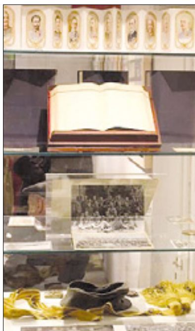
Ekspoziti (zgoraj) in spomenik umrlim vojakom 97. pešpolka v Radgoni (spodaj)

Na različnih dokumentih in fotografskih posnetkih je prikazana vojna pot enote, ki se je začela, nadaljevala in končala na ruskem bojišču; izjema je bil le njen 10. pohodni bataljon, ki se je bojeval na Soški fronti. 97. pešpolk je bil ob začetku vojne poslan na srbsko bojišče, vendar je bil že med potjo preusmerjen v Galicijo, kjer je 26. avgusta doživel ognjeni krst in nato sodeloval v različnih spopadih. Veliko njegovih pripadnikov je bilo zajetih ob padcu Przemisla. Vojno so nekatere manjše enote iz sestava dočakale v Odesi ob Črnem morju. Na bojnem polju, za posledicami ran ali v ujetništvu je umrlo okrog 2000 pripadnikov te enote. Zbrani in preverjeni podatki se nanašajo na 1160 mrtvih. Med slednjimi je tudi 52 Krmincev. Objavljen je seznam imen z osnovnimi podatki in navedbo okoliščin in kraja smrti ter pokopa. V 97. pešpolku je služil tudi Pietro Zorzon, rojen leta 1900, zadnji preživel avstro-ogrski vojak iz krminske občine (umrl je leta 2000).