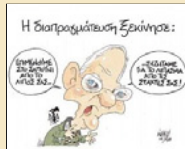
Sporna karikatura v grškem časniku

Malo verjetno je, da bi lahko dogovor o novem programu dosegli v tako kratkem času, torej do konca meseca. Poleg tega obstajajo pravne zahteve in omejitve ter vprašanje demokratične odgovornosti, so opozorili viri. Nekatere članice območja evra, na primer Nemčija in Finska, morajo namreč kakršen koli nov dogovor z Grčijo potrditi v parlamentih.