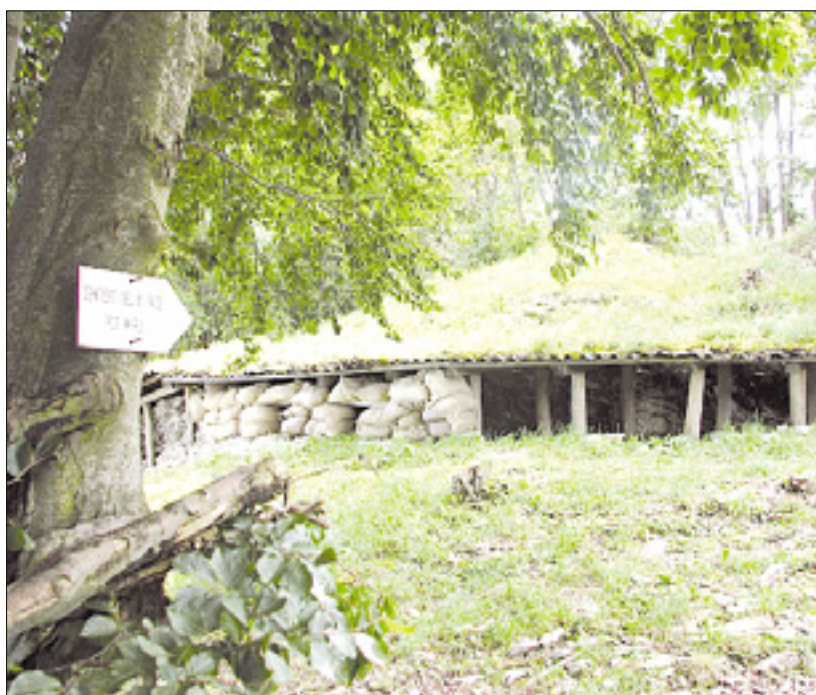
Kolovrat, muzej na prostem, je lani obiskalo 25.000 ljudi

KRMIN - Dokumentarna razstava o 97. pešpolku