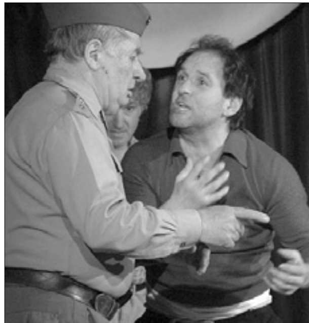
Prizor iz predstave (spodaj) in občinstvo (zgoraj)