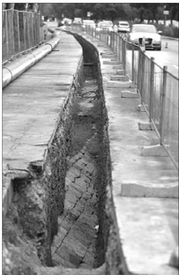
Pod novo cesto se je prikazala tista iz leta 1859

Podjetje AcegasApsAmga obnavlja kanalizacijo v Barkovljah, delavci pa so nehote že spet prispevali k boljšemu poznavanju krajevine zgodovine. Decembra 2013 so med odstranjevanjem dotrajanih cevi pod Miramarskim drevoredom pred hotelom Maria Greif celo odkrili ostanke starorimske vile in pristana, tokrat pa so pri prvih kopaljščih »Topolini« pod istim drevoredom, pri globini enega metra, naleteli na cesto iz 19. stoletja.