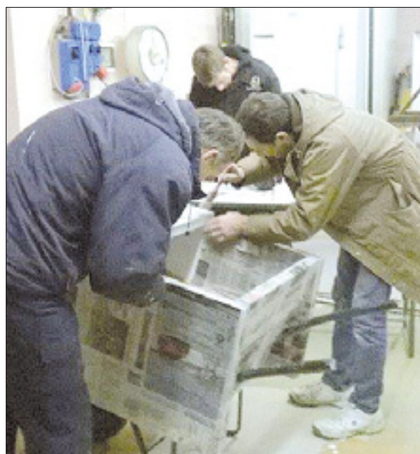
Priprave v Števerjanu