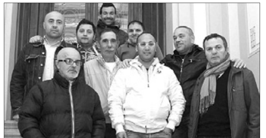
Delavci podjetja Beraud na županstvu