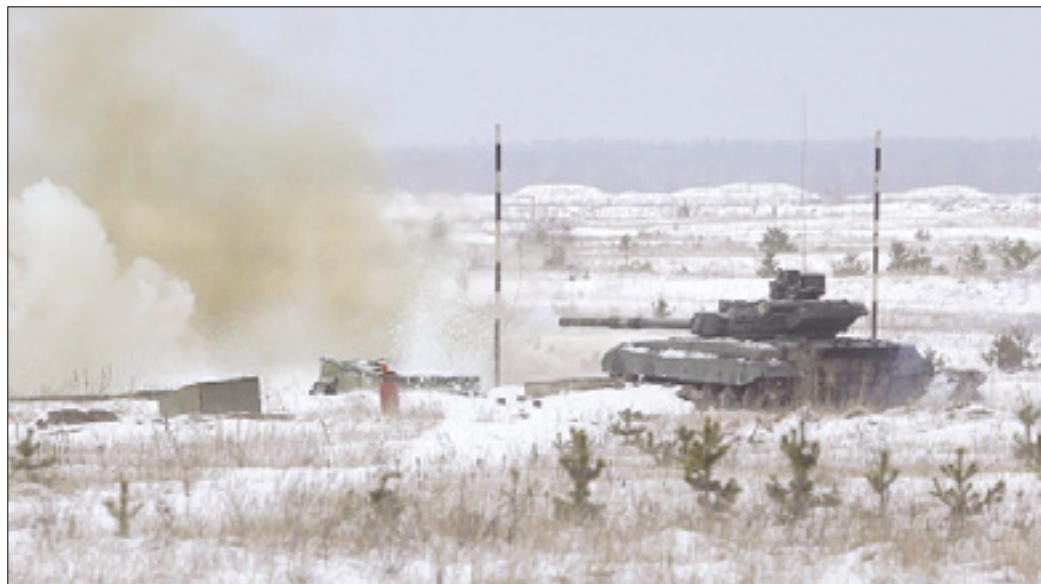
Najnovější ukrajinski mobiliziranci na vajah

Moskva za spoštovanje obveznosti iz dogovora v Minsku