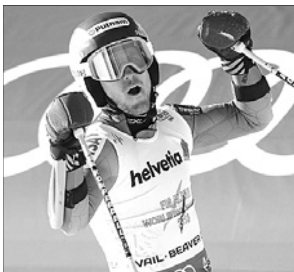
Američan Ted Ligety v ciljni areni

Američan Ted Ligety premagal Avstrijca Marcela Hirscherja