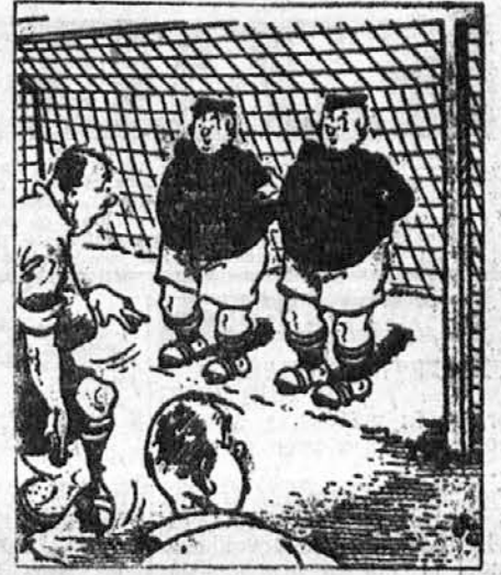
Predlog razočarane publike nekaterim klubom, ki tekmujejo v letošnjem nogometnem turnirju Slovenske nogometne zveze: — Postavite si dva golmana!